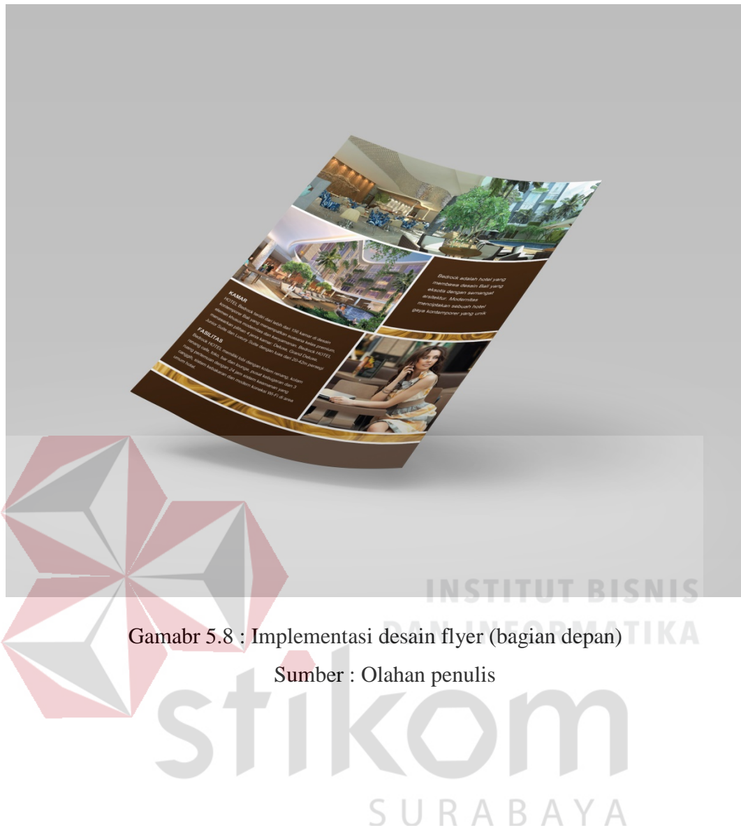
Gamabr 5.8 : Implementasi desain flyer (bagian depan)