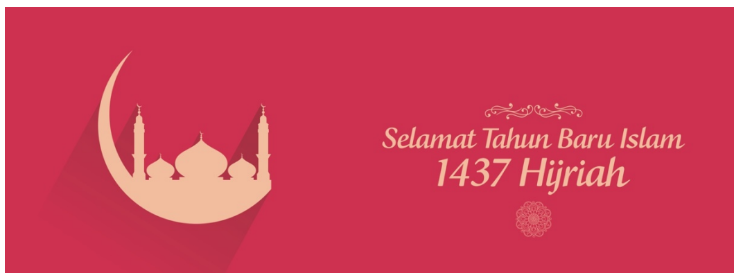
Gambar 6.6 : sampul facebook tema 1 Huharram