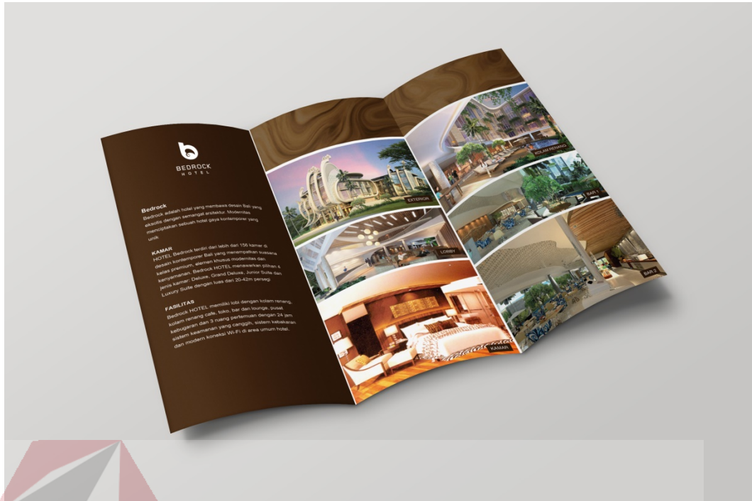
Gambar 5.4 : Implementasi desain brosur (bagian dalam)