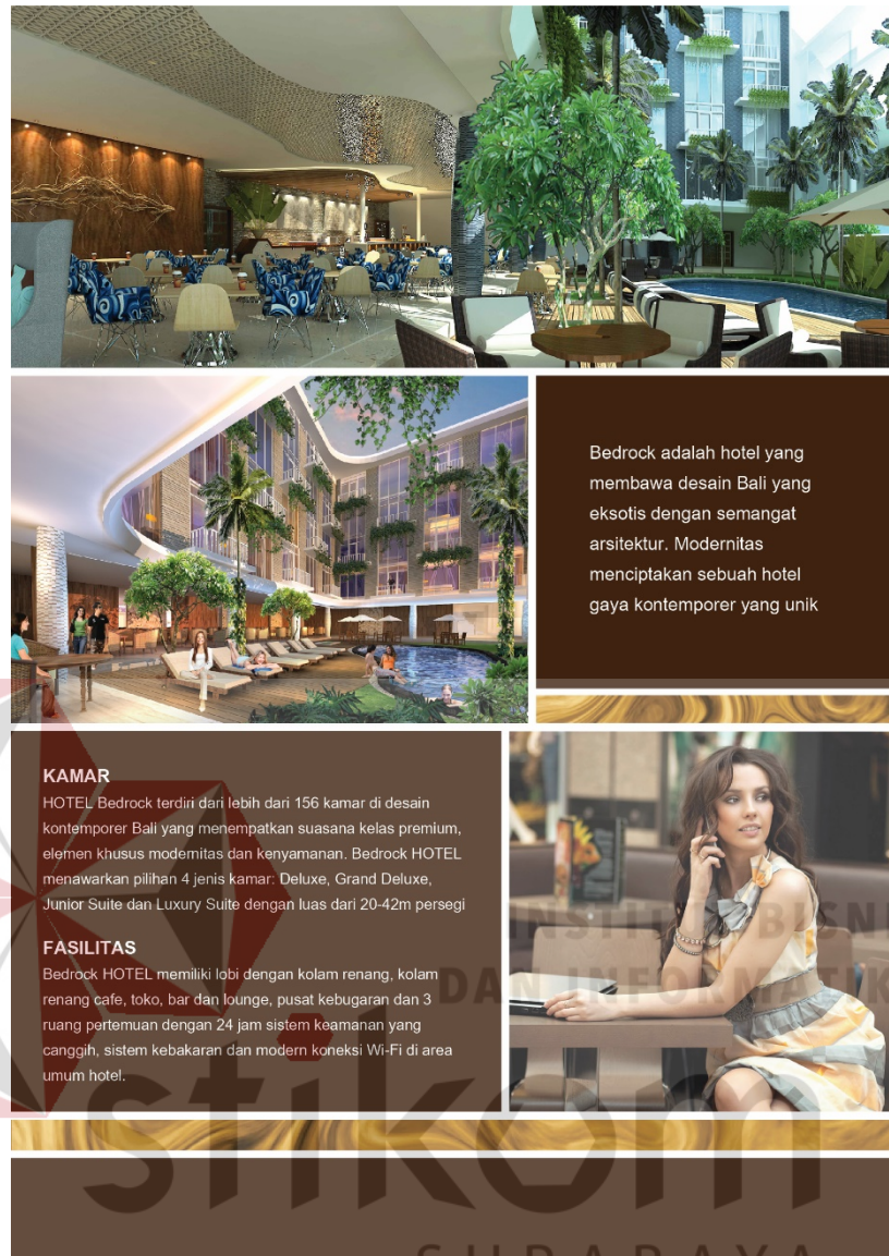
Gambar 5.7 : desain bagian belakang flyer