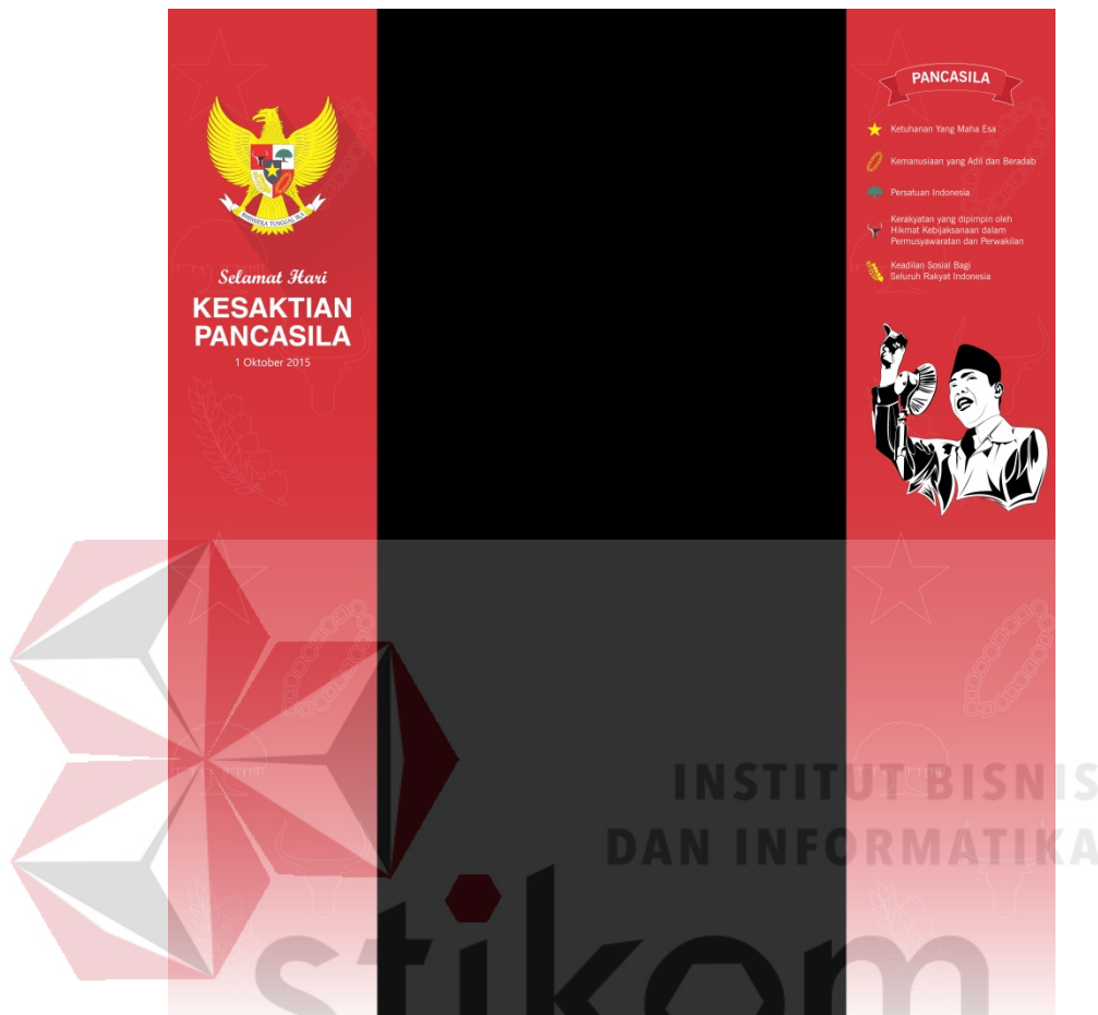
Gambar 6.3 : background web tema kesaktian pancasila