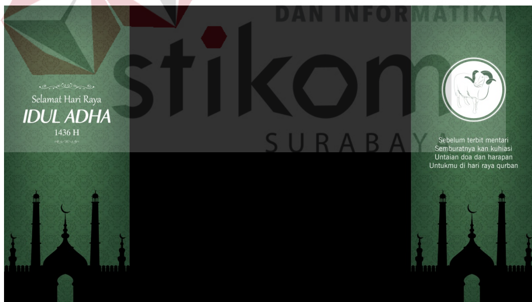
Gambar 6.1 : background web tema Idul Adha