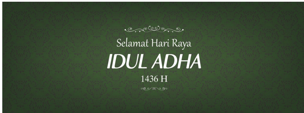
Gambar 6.2 : sampul facebook tema Idul Adha