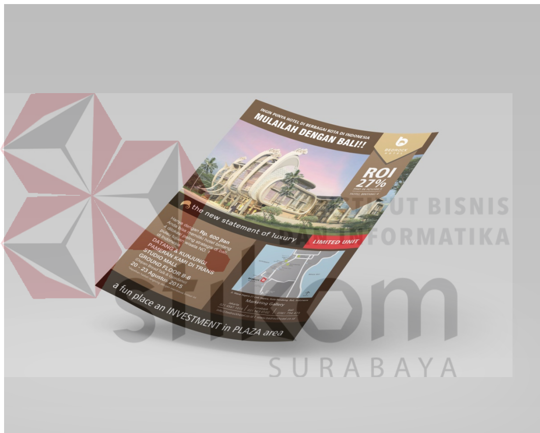
Gamabr 5.6 : Implementasi desain flyer (bagian depan)

Pada Gambar 5.3 merupakan bagian depan flyer yang didesain sesuai dengan informasi yang ingin disampaikan oleh Bedrock hotel, mulai dari harga, diskon, informasi pelayanan, peta lokasi, ajakan calon konsumen, pada intinya penekanan pada desain flyer ini ditunjukkan pada gedung dan diskon, agar menjadi minat utama untuk membaca flyer ini.