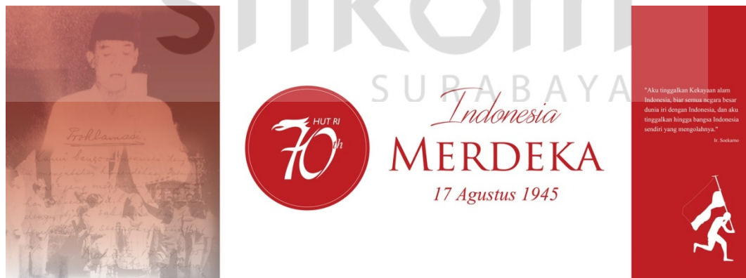
Gambar 6.0 : sampul facebook tema 17 Agustus