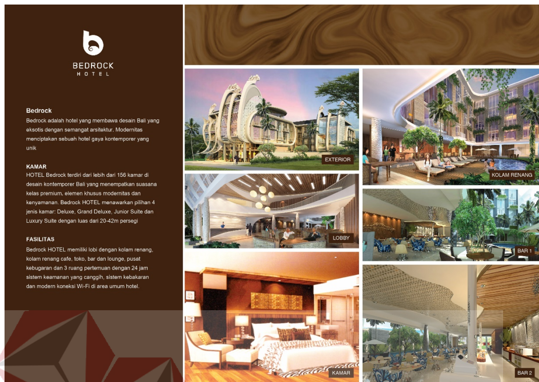
Gambar 5.3 : desain bagian dalam brosur