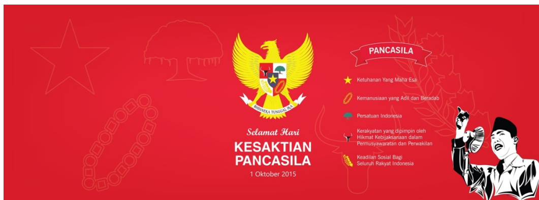
Gambar 6.4 : sampul facebook tema kesaktian pancasila