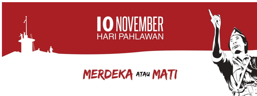
Gambar 6.8 : sampul facebook tema 10 November