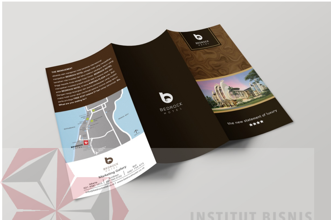
Gambar 5.2 : Implementasi desain brosur (bagian luar)

hotel, dan info marketing gallery, ada bagian tengah brosur ini hanya terdapat logo sebagai penutup .