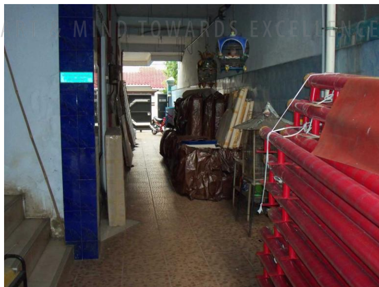
Gambar 2.3 Workshop PT. Astha Beribis Grafika