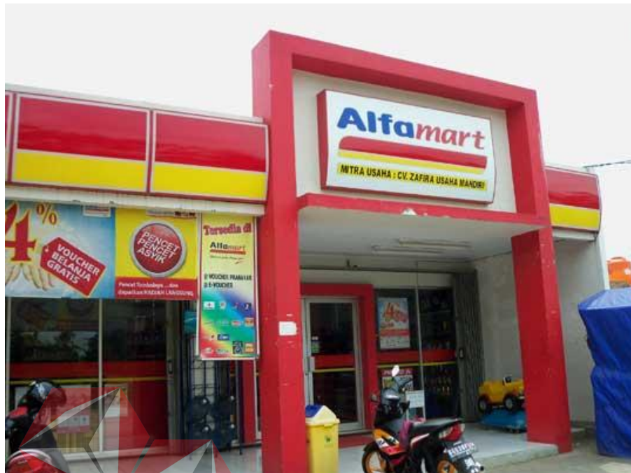
Gambar 2.6 Desain Toko Alfamart