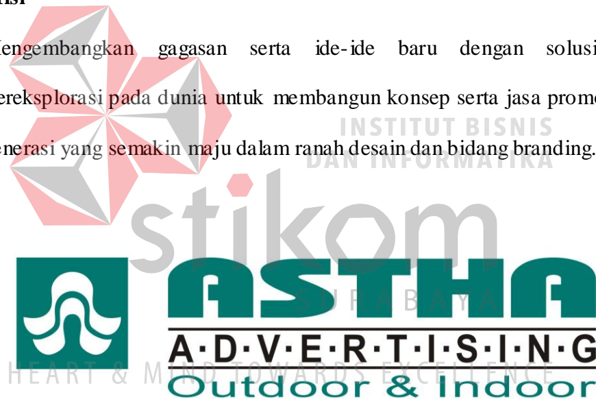
Gambar 2.1 Logo Astha Advertising

Mengembangkan gagasan serta ide-ide baru dengan solusi tepat. Bereksplorasi pada dunia untuk membangun konsep serta jasa promosi pada generasi yang semakin maju dalam ranah desain dan bidang branding.