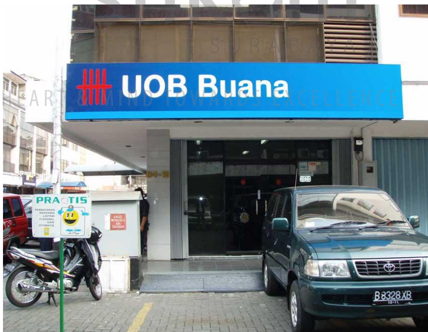
Gambar 2.7 Bank UOB Buana