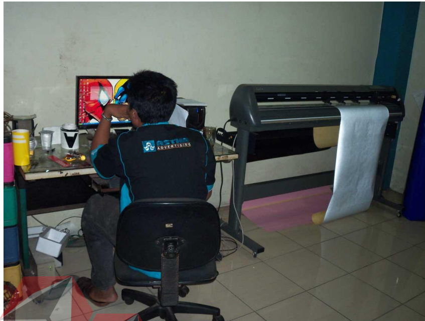
Gambar 2.4 Workshop PT. Astha Beribis Grafika