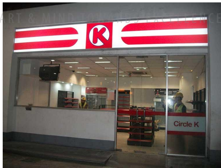
Gambar 2.5 Desain CircleK

Beberapa contoh portofolio karya yang telah dibuat oleh PT. Astha Beribis Grafika, sebagai berikut: