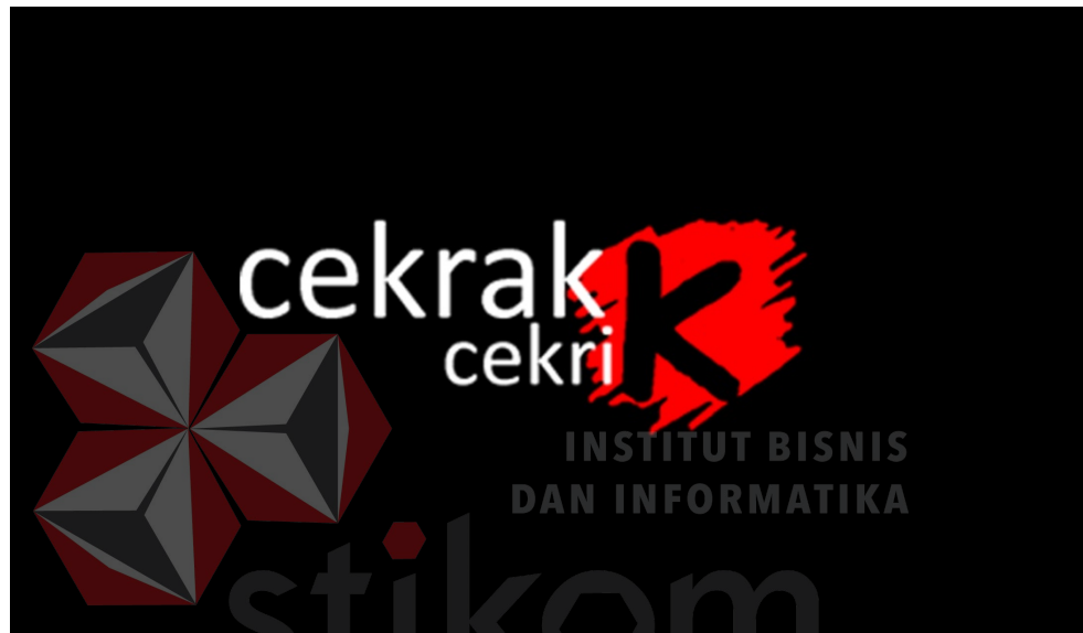
Gambar 2.1. Logo Cekrak Cekrik

Logo Cekrak Cekrik menggunakan komponen warna yang sangat menonjol, yaitu warna merah. Merah melambangkan gejolak semangat dan antusiasme yang tinggi. Menurut direktur Cekrak Cekrik, beliau menginginkan staf dari Cekrak Cekrik memiliki semangat dan etos kerja yang tinggi. Disamping itu, dibelakang huruf K terdapat goresan yang menyiratkan akselerasi dan kecepatan. Hal ini merupakan sebuah bentuk harapan agar Cekrak Cekrik dapat menjadi sebuah perusahaan yang berkembang dengan pesat dan juga memiliki pelayanan yang cepat dan tanggap dengan setiap kliennya.