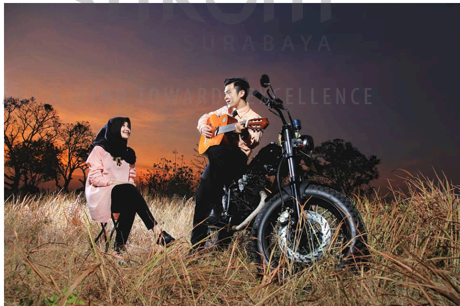
Gambar 4.4 Foto Prewedding 2