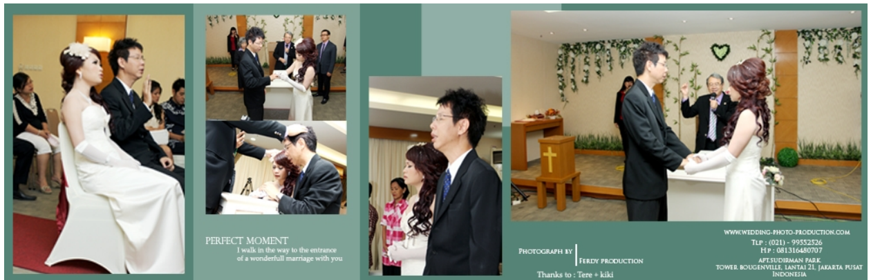
Gambar 4.1 Referensi Layout