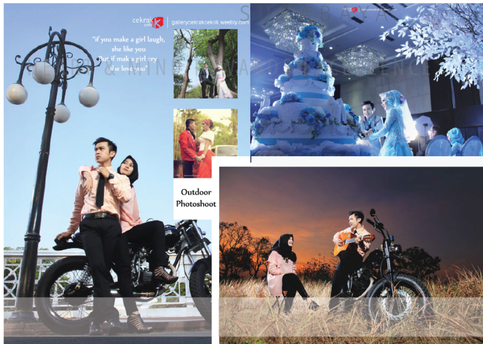
Gambar 4.8 Brosur