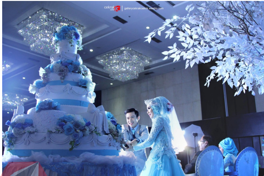
Gambar 4.5 Foto wedding