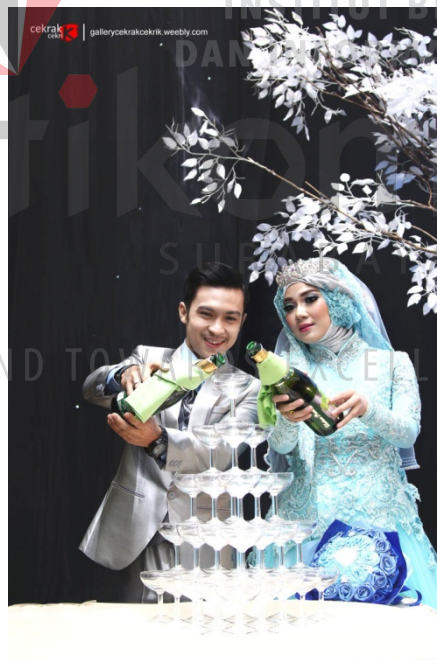
Gambar 4.6 Foto Wedding 2