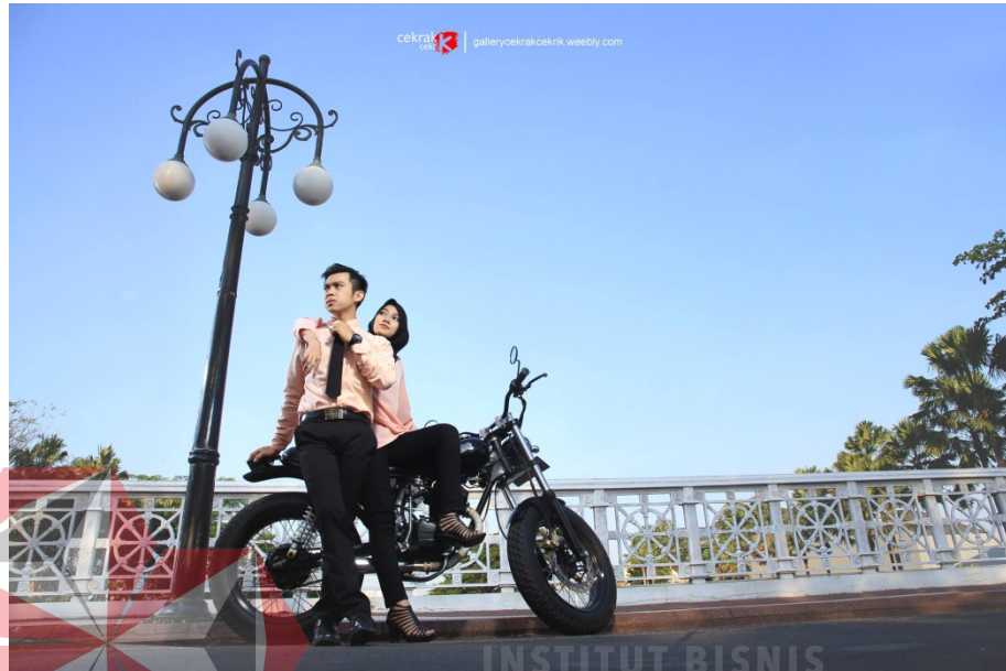
Gambar 4.3 Foto prewedding