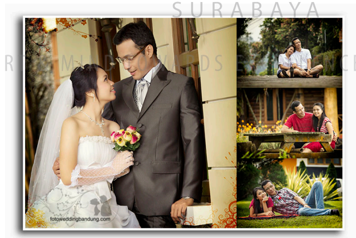
Gambar 4.2 Referensi Teknik Foto

Gambar 4.1 menunjukkan gambar acuan untuk pembuatan brosur cekrak-cekrik wedding organizer. Dalam gambar ini menunjukkan tentang elegan dengan menggunakan pakaian yang casual. Tata letak dalam referensi ini tidak terlalu rumit dan pemilihan warna yang sesuai dengan suasana pernikahan yang sakral.