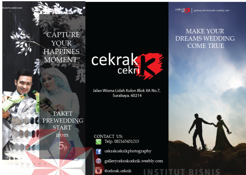
Gambar 4.7 Brosur