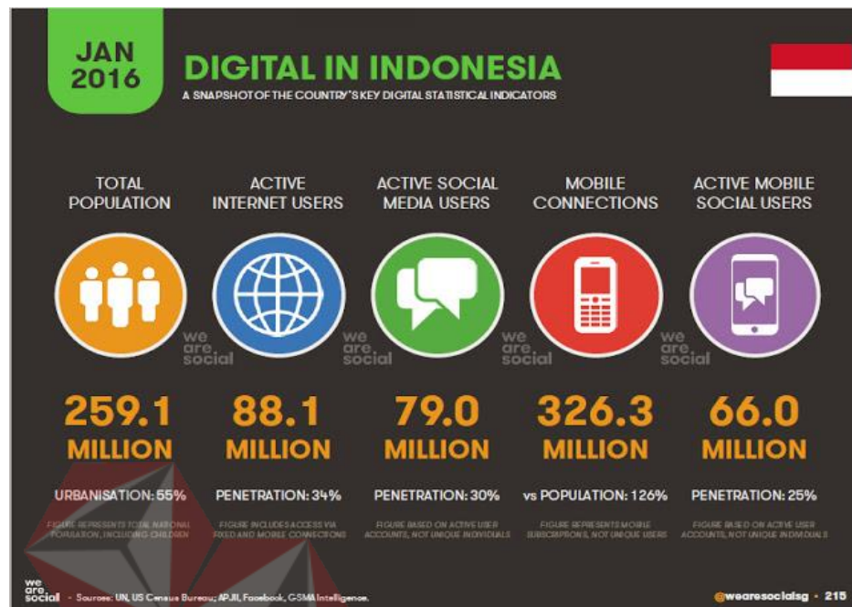
Gambar 1.2 Statistik Pengguna Internet Indonesia

(Sumber : Http://www.slideshare.com/wearesocialsg/2016-digital-yearbook )