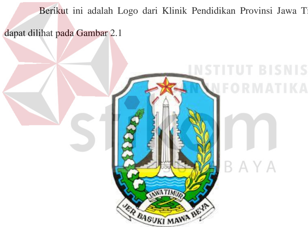
Gambar 2. 1 Logo Klinik Pendidikan Provinsi Jawa Timur

Berikut ini adalah Logo dari Klinik Pendidikan Provinsi Jawa Timur, dapat dilihat pada Gambar 2.1