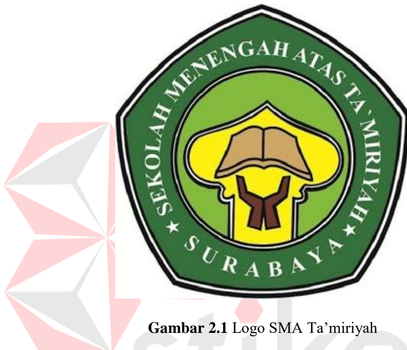
Gambar 2.1 Logo SMA Ta'miriyah

Berikut Gambar 2.1 merupakan logo dari SMA Ta'miriyah Surabaya yang diterapkan hingga saat ini :