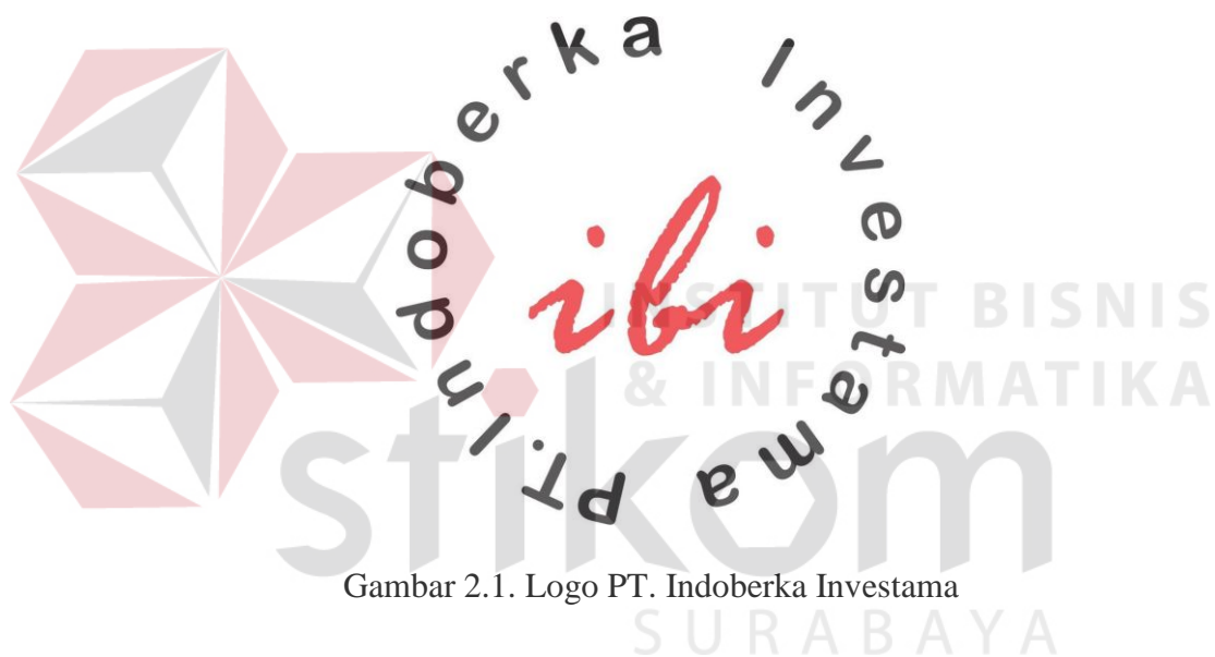
Gambar 2.1. Logo PT. Indoberka Investama

Gambar 2.1 di bawah merupakan logo dari PT. Indoberka Investama, logo tersebut merupakan logo terakhir yang saat ini digunakan oleh PT. Indoberka Investama.