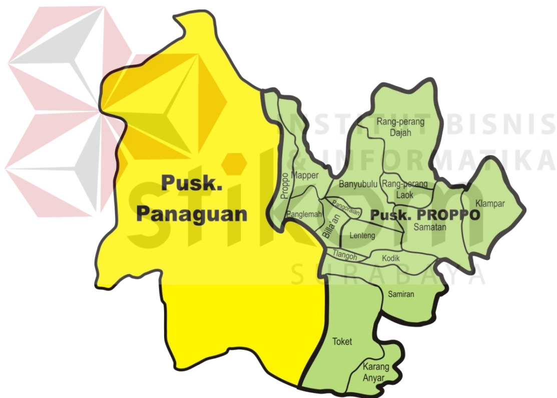
Gambar 2.1 Wilayah Kerja UPT Puskesmas Proppo

Sarana dan prasarana di Puskesmas Proppo yang tersedia dalam memberikan pelayanan kepada masyarakat terdiri dari: