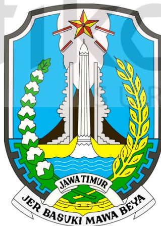
Gambar 2.1 Logo Dinas Pendidikan Provinsi Jawa Timur

Berikut ini adalah Logo dari Dinas Pendidikan Provinsi Jawa Timur, dapat dilihat pada Gambar 2.1