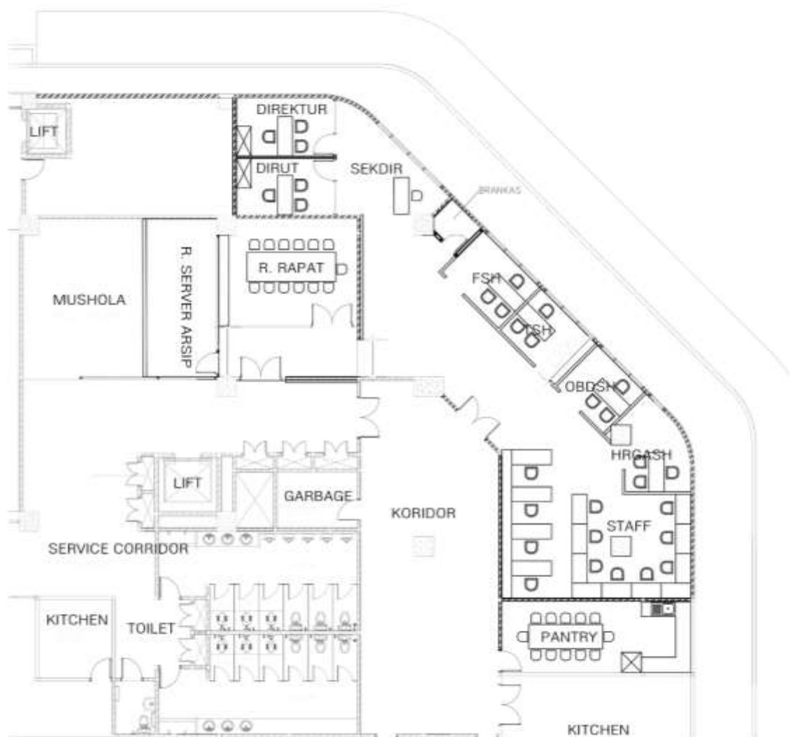
Gambar 2.3 Layout Kantor PT Pelindo Properti Indonesia

PT Pelindo Properti Indonesia berada di Terminal Gapura Surya Nusantara, Lantai 2, Tanjung Perak – Surabaya. Layout Kantor PT Pelindo Properti Indonesia dapat dilihat pada Gambar 2.3