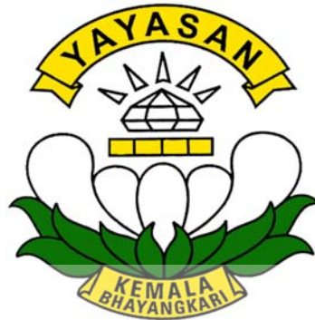
Gambar 2.1 Logo Yayasan Kemala Bhayangkari

Gambar 2.1 di bawah merupakan logo dari SD Kemala Bhayangkari 1 Surabaya, logo tersebut merupakan logo terakhir dari SD Kemala Bhayangkari 1 Surabaya yang sama dengan logo yayasan Kemala Bhayangkari.