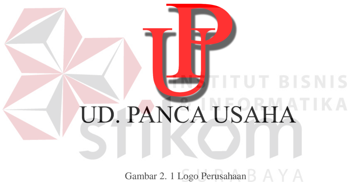
Gambar 2. 1 Logo Perusahaan