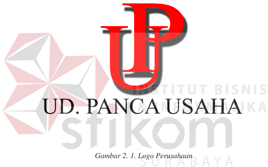
Gambar 2. 1. Logo Perusahaan