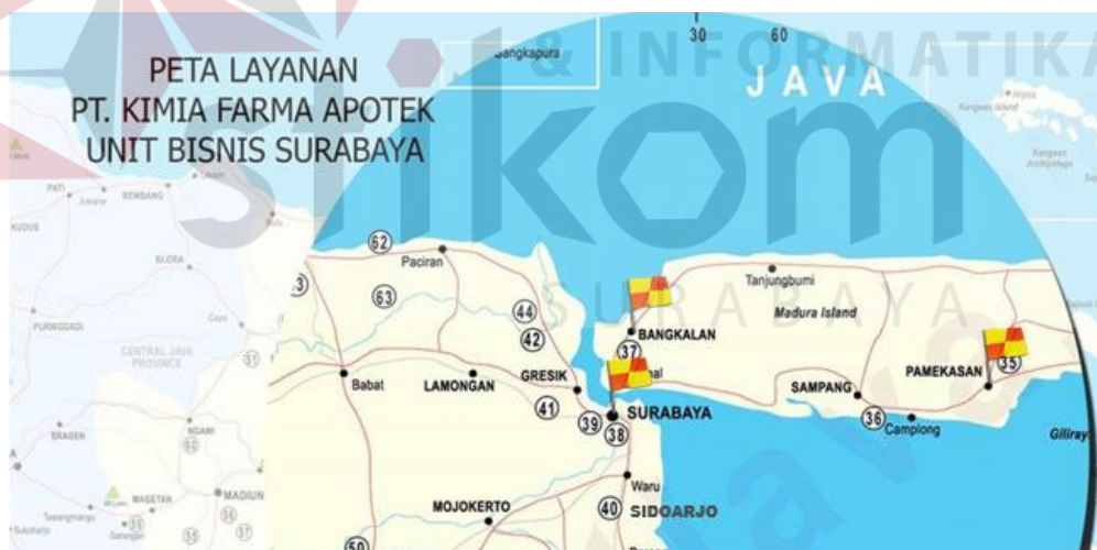
Gambar 2.2 Peta Sebaran Cakupan Unit Bisnis Surabaya

PT Kimia Farma Unit Bisnis Surabaya memiliki cakupan wilayah untuk outlet di area kota Surabaya dan pulau Madura. Adapun lingkup cakupan tersebut dapat dilihat pada Gambar 2.2: