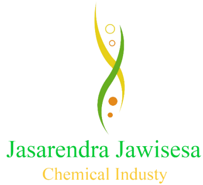
Gambar 2.1 Logo PT. Jasarendra Jawisesa