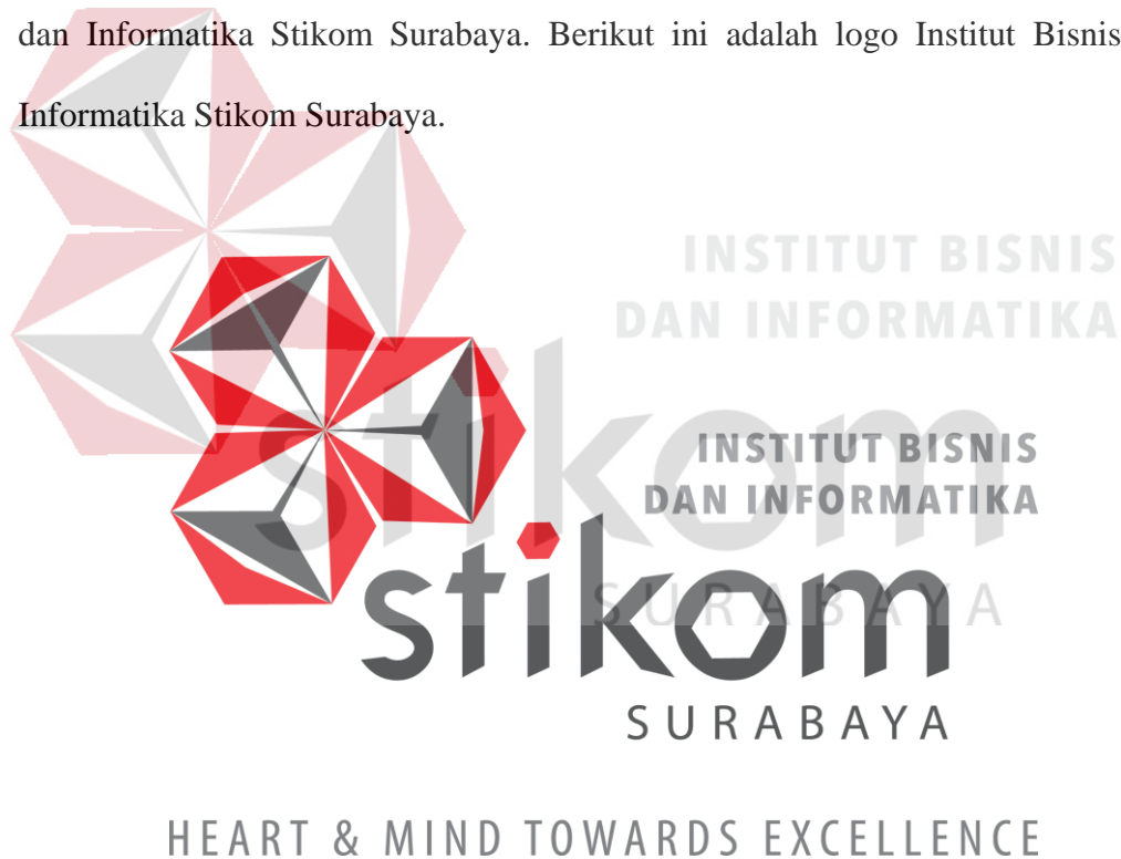
Gambar 2.1 Logo Institut Bisnis dan Informatika Stikom Surabaya

Dalam melakukan kerja praktik, sangat penting sekali bagi mahasiswa dalam mengenal sebuah lingkungan dari perusahaan/instansi tersebut. Baik dari segi perorangan hingga dari segi lingkungan disekitar perusahaan/instansi. Karena ini akan sangat dibutuhkan ketika melakukan masa kerja. Fakultas Ekonomi dan Bisnis bertempat di lantai 7 Gedung Merah Institut Bisnis dan Informatika Stikom Surabaya yang beralamatkan di Jl. Kedung Baruk No. 98, Surabaya. Gambar 2.2 dan gambar 2.3 merupakan tempat di Fakultas Ekonomi dan Bisnis Institut Bisnis dan Informatika Stikom Surabaya. Berikut ini adalah logo Institut Bisnis dan Informatika Stikom Surabaya.