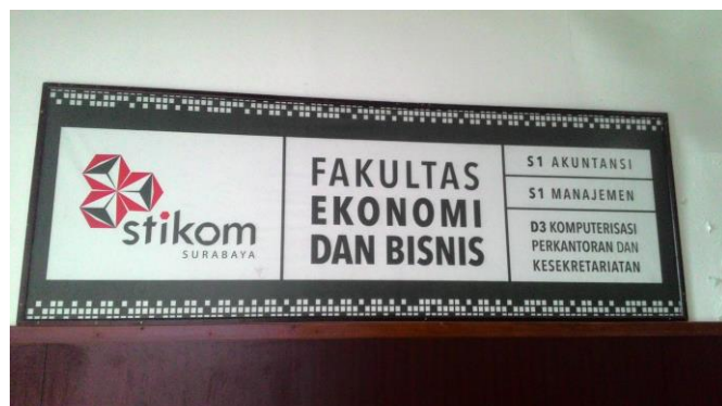
Gambar 2.3 Letak Fakultas Ekonomi dan Bisnis Stikom Surabaya