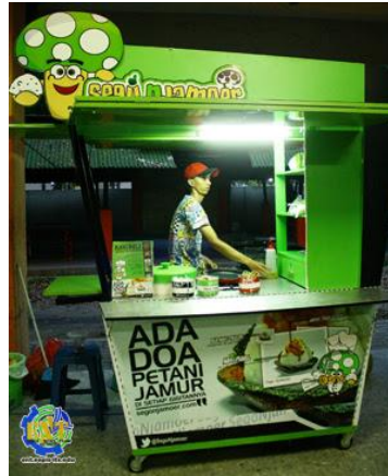
Gambar 2.3 Salah Satu Outlet Sego Njamoer

Gambar 2.3 di atas merupakan salah satu outlet Sego Njamoer. Desain booth yang digunakan sangat sederhana namun menarik, dengan kombinasi warna hijau muda yang mendominasi membuat desain booth Sego Njamoer memiliki daya tarik yang mampu menjadi point of interest sebagai sebuah produk. Di bagian bawah booth , terdapat tagline Sego Njamoer “Ada Doa petani Jamur Di Setiap Gigitannya”. Gambar 2.4 di bawah merupakan ruang kerja perusahaan Sego Njamoer yang digunakan penulis untuk menyelesaikan proyek Kerja Praktik.