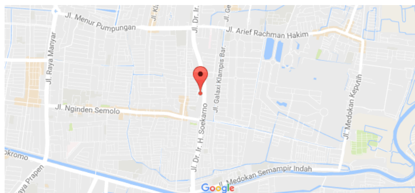
Gambar 2.2 Peta Lokasi CV Sego Njamoer Surabaya

Lokasi kantor Sego Njamoer sangat dekat dengan kampus Stikom Surabaya, pada gambar 2.2 merupakan peta lokasi kantor Sego Njamoer yang dilihat melalui Google Maps.