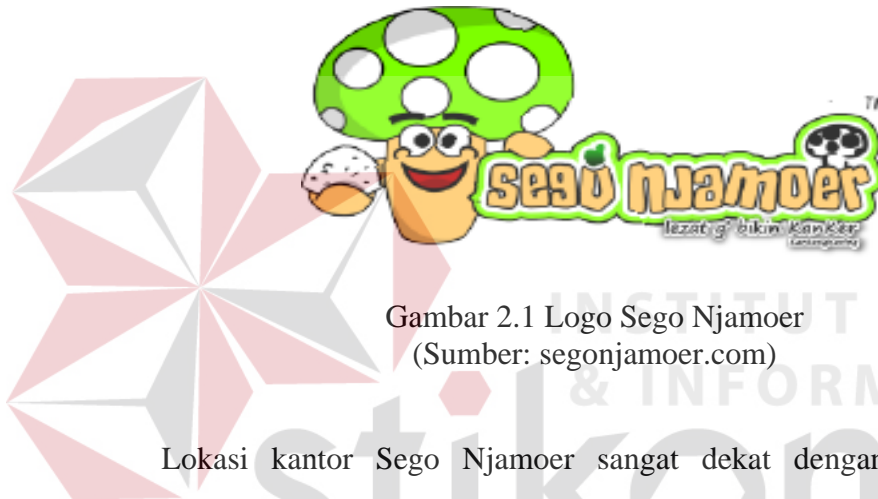
Gambar 2.1 Logo Sego Njamoer

Dalam melakukan sebuah kerja praktik, sangat penting sekali dalam mengenal sebuah lingkungan dari perusahaan/instansi tersebut. Baik dari segi perorangan hingga dari segi lingkungan disekitar perusahaan/instansi. Karena ini akan sangat dibutuhkan ketika melakukan masa kerja. CV Sego Njamoer mempunyai kantor yang berada di Jalan Klampis Semolo Timur XII Nomor 2. Gambar 2.1 di bawah merupakan logo dari perusahaan Sego Njamoer.