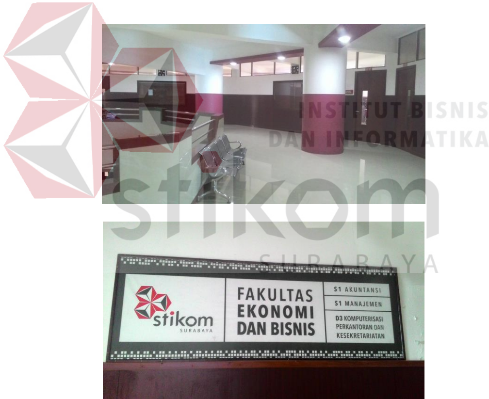
Gambar 2.3 Letak Fakultas Ekonomi dan Bisnis Stikom Surabaya