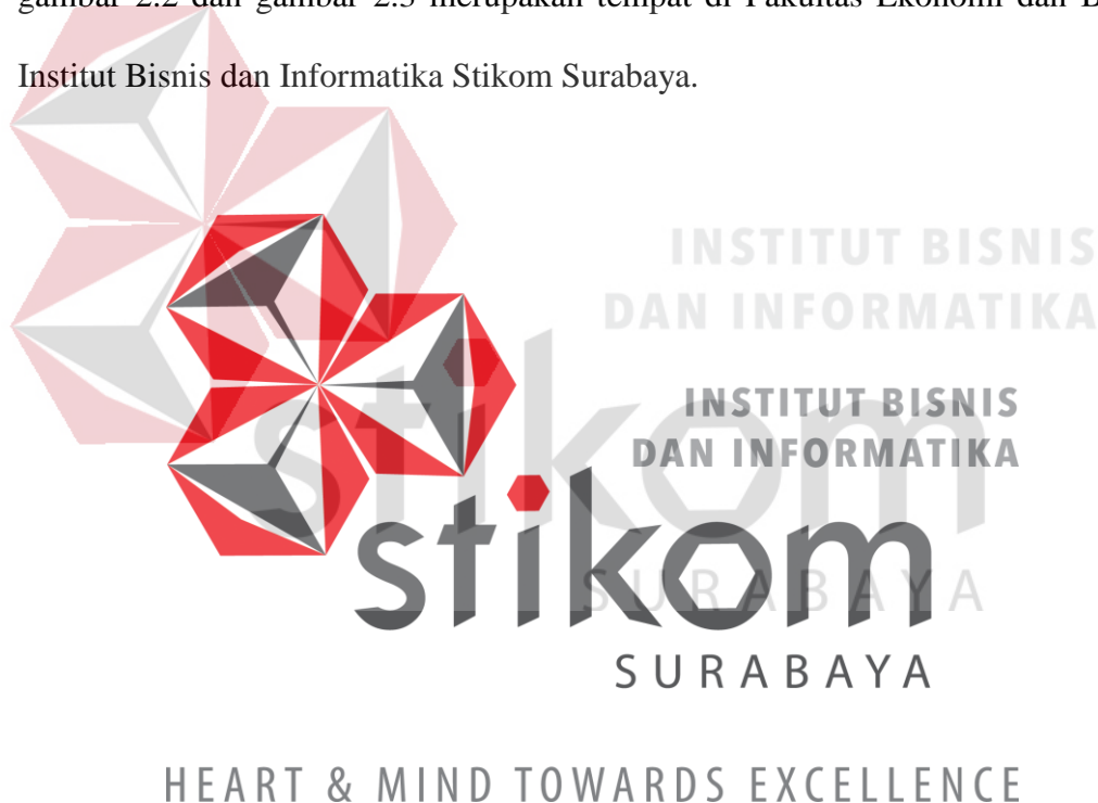
Gambar 2.1 Logo Institut Bisnis dan Informatika Stikom Surabaya

Dalam melakukan kerja praktik, sangat penting sekali bagi mahasiswa dalam mengenal sebuah lingkungan dari perusahaan/instansi tersebut. Baik dari segi perorangan hingga dari segi lingkungan di sekitar perusahaan/instansi, karena ini akan sangat dibutuhkan ketika melakukan masa kerja. Fakultas Ekonomi dan Bisnis bertempat di lantai 7 Institut Bisnis dan Informatika Stikom Surabaya yang beralamatkan di Jl. Kedung Baruk No. 98, Surabaya. Tampak dari gambar 2.1 yang merupakan logo dari Institut Bisnis dan Informatika Stikom Surabaya, gambar 2.2 dan gambar 2.3 merupakan tempat di Fakultas Ekonomi dan Bisnis Institut Bisnis dan Informatika Stikom Surabaya.