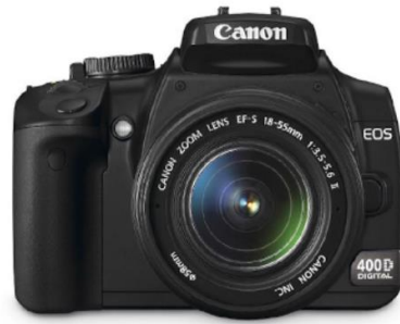
Gmabar 3.2 Kamera DSLR