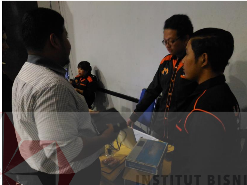
Gambar 4.23 Proses pemasangan alat

Proses pemasangan kabel antara Swicther dan kamera karena pada hariha ada sedikit kendala karena gmba pada kamera tidak mau tampil ke layar LCD.