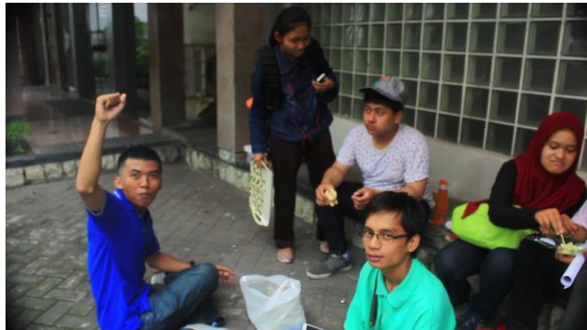
Gambar 4.15 Potongan behind the scene di taman bungkul

Pada saat proses shooting behind the scene saat bazaar di lobby yang disorot atau menjadi focus adalah saat interaksi dari para peserta dan mahasiswa lain yang tertarik dengan produk – produk yang mereka jual, seperti gambar 4.16 dibawah ini.