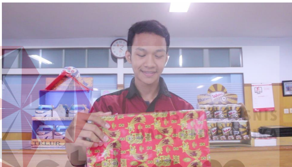
Gambar 4.3 Potongan Iklan FEB Fair 2016

Shooting untuk iklan FEB Fair dilakukan di setiap prodi dan menunjukan bahwa semua prodi yang ada dalam Institut Bisnis dan Informatika STIKOM Surabaya mengetahui dan menerima undangan bahwa akan di selenggarakannya acara FEB Fair 2016 Fakultas Ekonomi dan Bisnis. Potongan gambar 4.3 dan 4.4 di bawah ini yang menerima undangan dari prodi Desain Grafis dan Management Informatika.