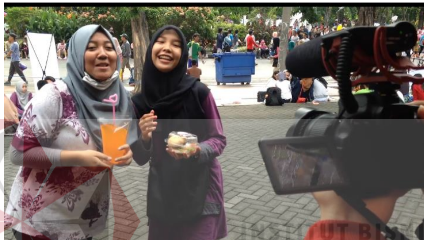
Gambar 4.7 Potongan shooting profil kelompok

Pada minggu yang sama kita juga mengikuti semua kelompok untuk berjualan ke taman bungkul untuk melakukan shooting profil kelompok. Pada saat shooting di taman bungkul teknik gerakan kamera yang banyak dilakukan adalah panning dan framing , karena hanya merekam objek pada satu tempat saja seperti gambar dibawah.