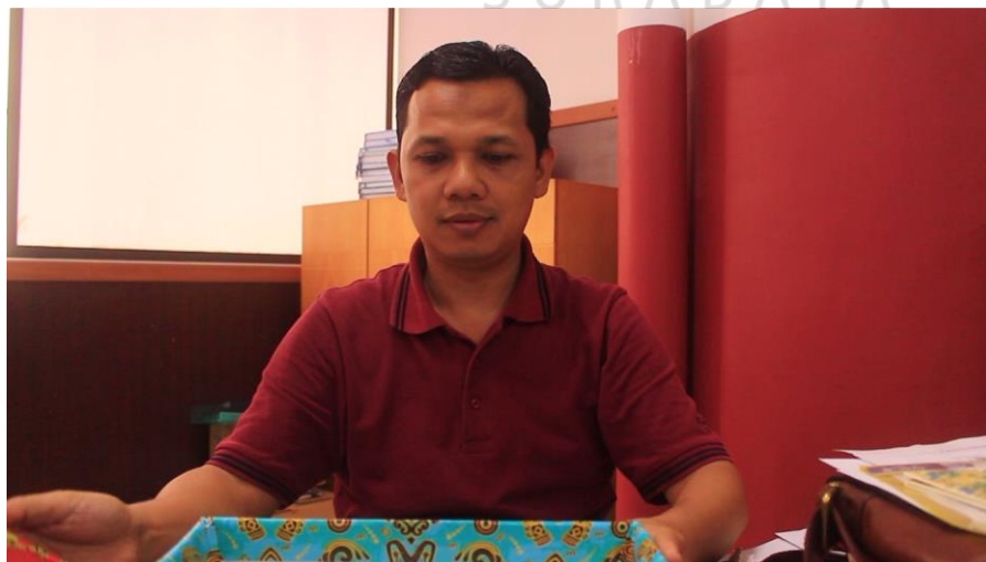
Gambar 4.6 Potongan gambar iklan ketua umu FEB Fair 2016