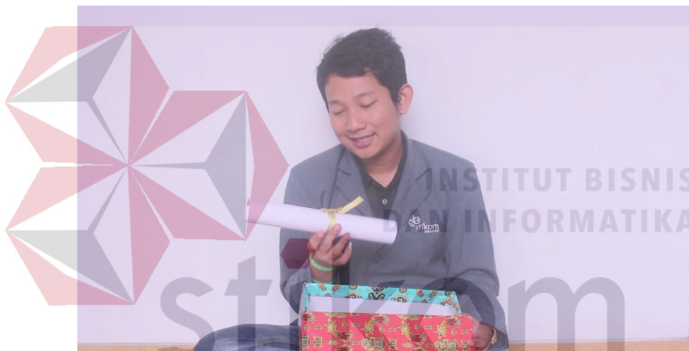
Gambar 4.5 Undangan dari ketua pelaksana FEB Fair 2016

Proses shooting untuk iklan yang dimulai dari ketua pelaksana pada gambar 4.5 di bawah, untuk diberikan kepada seluruh prodi yang ada. Seluruh prodi akan membuka gulungan yang ada di kotak tersebut untuk mengetahui undangan didalamnya bahwa seluruh Fakultas Ekonomi dan Bisnis akan menyelenggarakan acara FEB Fair 2016. Pada tahap ini direct of photography membantu sutradara untuk mengarahkan kameramen bagaimana harus menempatkan talent dan kamera yang sesuai.