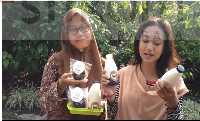
Gambar 4.8 Potongan shooting profil kelompok