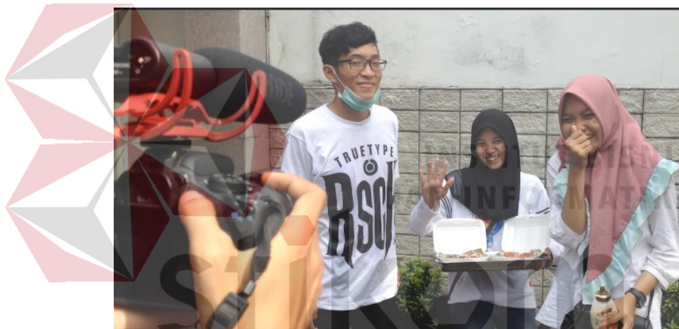
Gambar 4.12 Potongan shooting profil kelompok

Proses shooting untuk profil kelompok pada minggu kedua ini sama dengan minggu pertama, kita berhenti pada satu set tempat yang dirasa bagus untuk background lalu kita melakukan proses shooting gambar di atas 4.11 dan 4.12 yang merupakan potongan shooting profil kelompok.