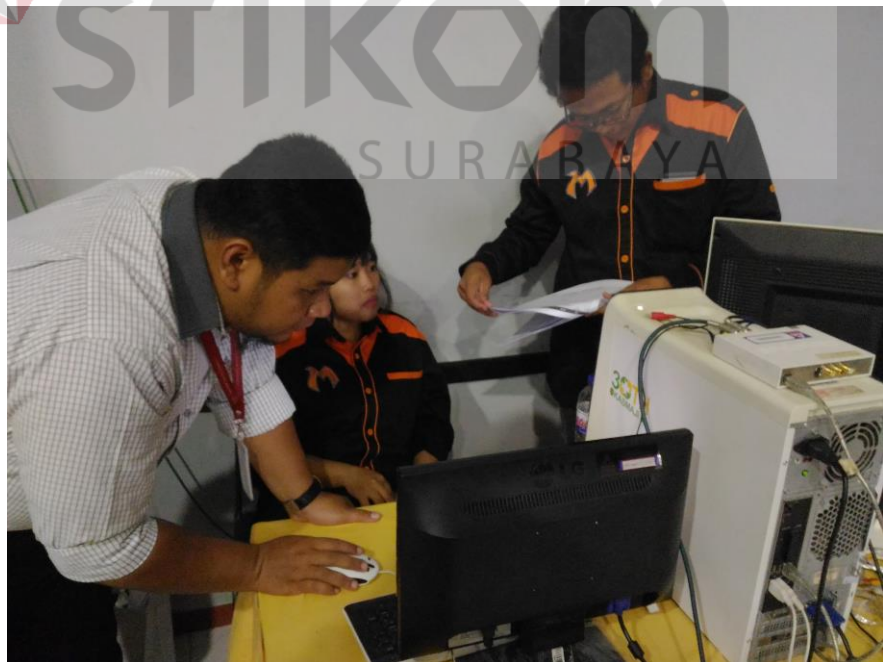
Gambar 4.24 Proses pemasangan alat dan komputer