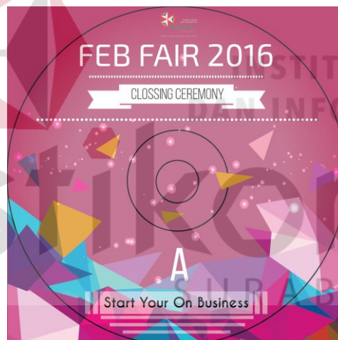
Gambar 4.30 Desain keeping CD