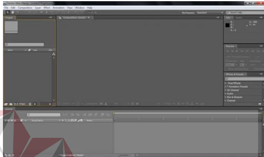
Gambar 4.20 Tampilan awal Adobe After Effect

sama seperti pada adobe after effect namun tidak halus seperti pada adobe after effect. gambar tampilan awal adobe after effect seperti gambar 4.20 dibawah ini.