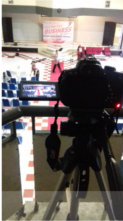
Gambar 4.26 Pemasangan kamera

Pengecekan rundown agar apa yang kita putar tidak ada yang salah dan juga dapat terjadi miss communication .