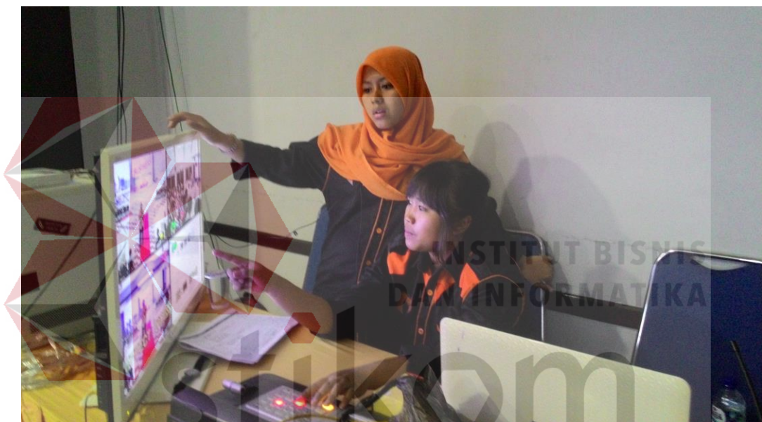
Gambar 4.28 Proses pemilihan gambar pada layar switcher

Proses pemilihan gambar oleh asisten sutrdara yang dibawah langsung oleh sutradara agar gambar yang tampil di layar sesuai dan dapat nikmat untuk dilihat oleh tamu yang datang, proses ini juga mempermudah kita pada saat editing karena pada saat kita memindah gambar secara langsung sudah teredit pada rekaman di adobe premiere .