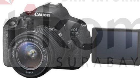
Gambar 4.1 Kamera Dslr Canon 700D

Dalam pembuatan dokumentasi tentu saja mempersiapkan alat untuk merekam yaitu menggunakan kamera Dslr seperti gambar 4.1 dan alat perekam suara yang langsung tersambung ke kamera yaitu Rode seperti gambar 4.2 di bawah ini.