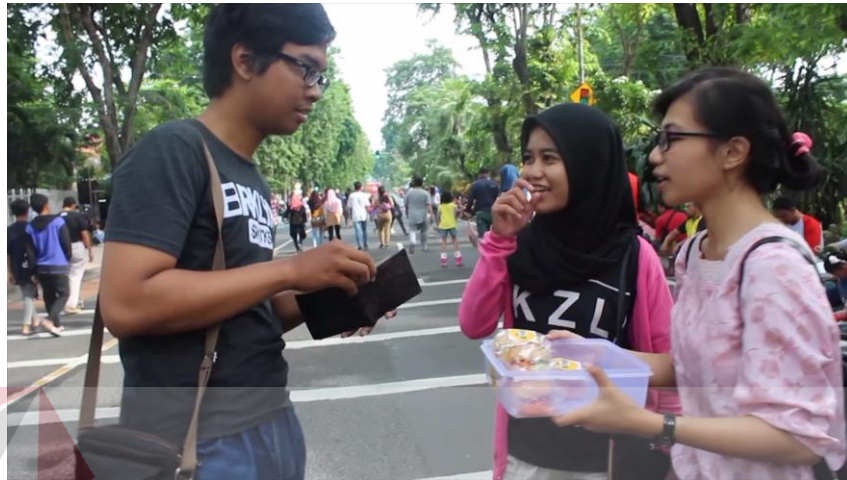
Gambar 4.13 Potongan shooting profil kelompok

follow dimana kamera mengikuti objek yang bergerak pada gambar 4.13 di bawah ini.