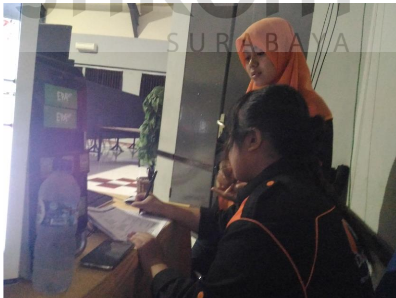
Gambar 4.27 Mengecek ulang rundown

Pengecekan rundown agar apa yang kita putar tidak ada yang salah dan juga dapat terjadi miss communication .