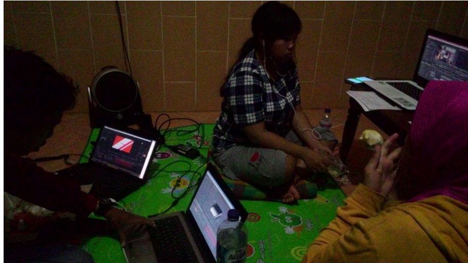
Gambar 4.21 Proses editing bts dan bumper opening

Pada hariha acara FEB Fair 2016 pemasangan alat dan kamera sudah siap untuk dioperasikan, mulai dari switcher, computer untuk merekam, layar LCD, dan juga yang pasti kamera.