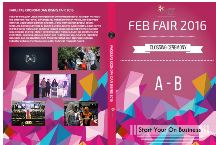
Gambar 4.29 Desain tempat CD FEB Fair 2016

CDnya. Desain tempat cd dan keeping cd bisa dilihat pada gambar 4.29 dan 4.30 dibawah ini.