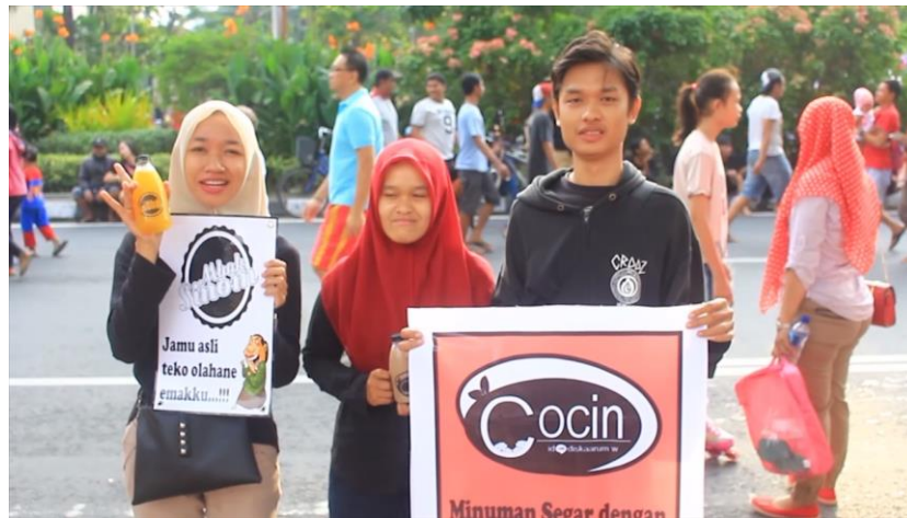
Gambar 4.11 Potongan shooting profil kelompok