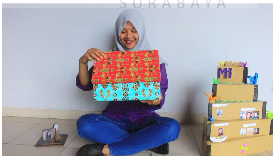
Gambar 4.4 Potongan Iklan FEB Fair 2016