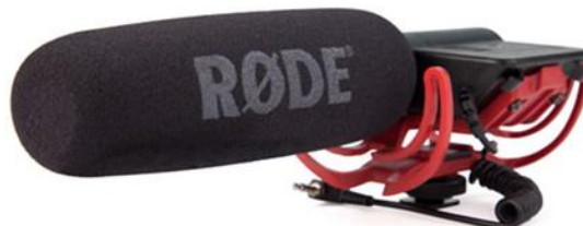
Gambar 4.2 Mic Rode