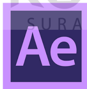
Gambar 4.19 Logo Adobe After Effect

Pada proses editing selanjutnya kita memakai software adobe after effect , software ini lebih akrab untuk pembuatan animasi atau bumper, dapat juga untuk editing efek video. seperti gambar 4.19 dibawah ini.