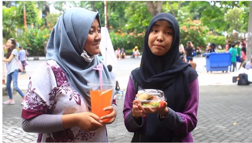
Gambar 4.9 Potongan shooting profil kelompok