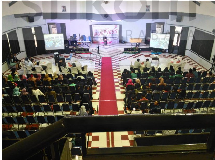
Gambar 4.22 Hariha FEB Fair

Pada hariha acara FEB Fair 2016 pemasangan alat dan kamera sudah siap untuk dioperasikan, mulai dari switcher, computer untuk merekam, layar LCD, dan juga yang pasti kamera.