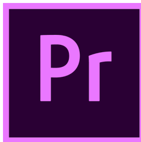
Gambar 4.17 Logo Adobe Premiere

Pada tahap proses editing video kita perlu mengenal software yang paling umum digunakan yaitu adobe premiere dan jika ada tambahan editing menggunakan efek yang lebih dapat menggunakan adobe after effect . seperti pada gambar 4.17 dan 4.19 di bawah ini.