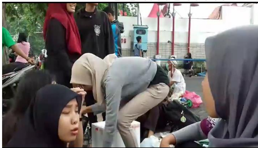
Gambar 4.14 Potongan behind the scene di taman bungkul

Pada proses shooting untuk behind the scene menggunakan teknik timelipes karena sebagian merekam saat proses mereka menunggu anggota yang belum datang atau pula yang sedang melakukan persiapan untuk berjualan seperti gambar 4.14 dan 4.15 di bawah ini.