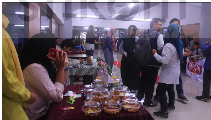
Gambar 4.16 Potongan behind the scene bazaar

Pada saat proses shooting behind the scene saat bazaar di lobby yang disorot atau menjadi focus adalah saat interaksi dari para peserta dan mahasiswa lain yang tertarik dengan produk – produk yang mereka jual, seperti gambar 4.16 dibawah ini.