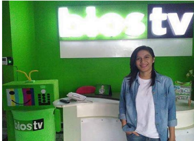
Gambar 2.3 Lobby Bios TV Surabaya