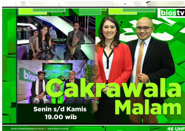
Gambar 2.6 Cakrawala Malam di Bios TV Surabaya