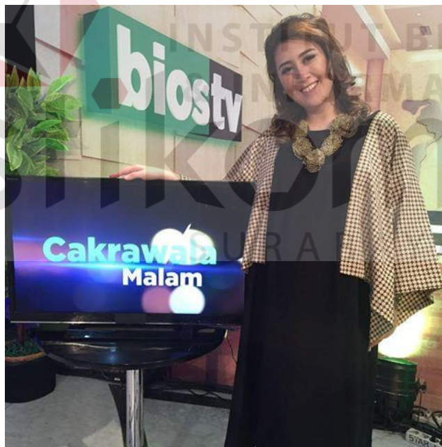
Gambar 2.7 Salah satu presenter Cakrawala Malam di Bios TV Surabaya