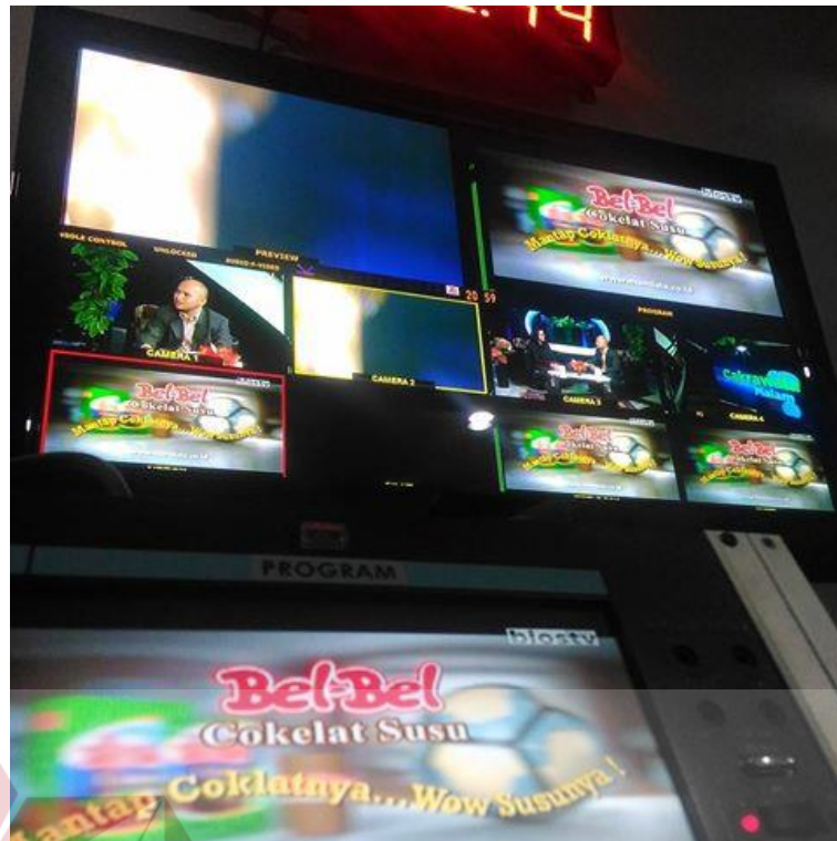
Gambar 2.8 Ruang Program Director di Bios TV Surabaya