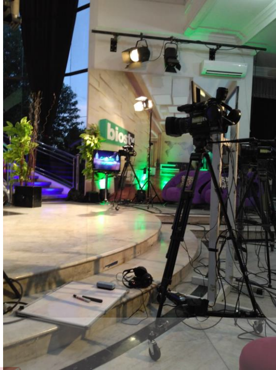
Gambar 2.5 Studio Cakrawala Malam di Bios TV Surabaya