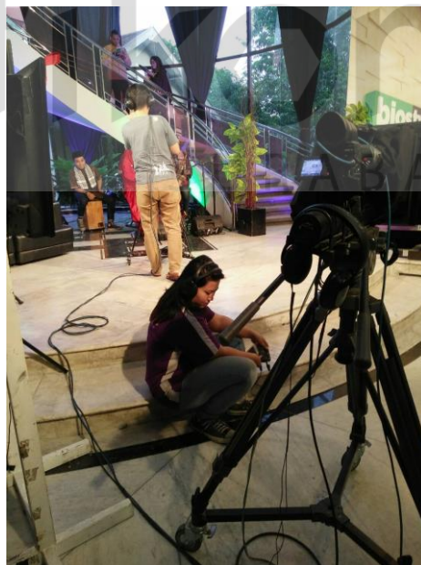
Gambar 2.9 Live Cakrawala Malam di Bios TV Surabaya