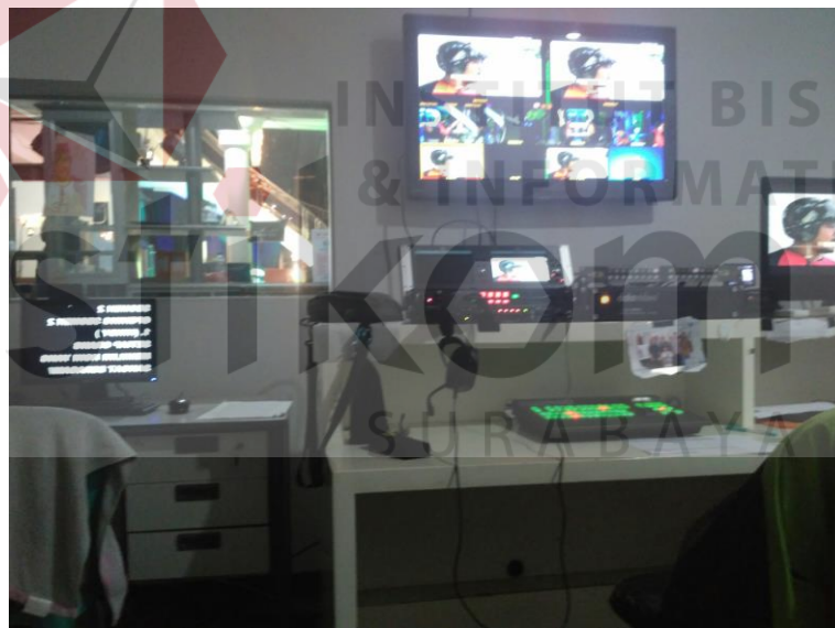
Gambar 2.4 Ruang Program Director di Bios TV Surabaya