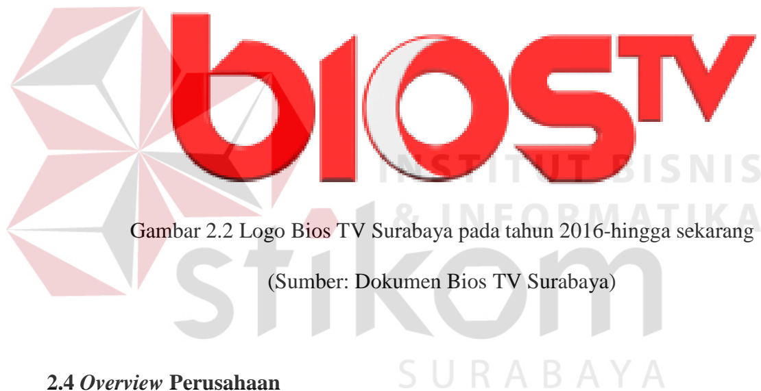
Gambar 2.2 Logo Bios TV Surabaya pada tahun 2016-hingga sekarang