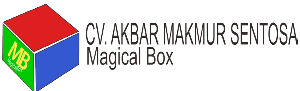
Gambar 2.1 Logo CV. Akbar Makmur Sentosa

Dalam melakukan sebuah kerja praktik, sangat penting sekali dalam mengenal sebuah lingkungan dari perusahaan/instansi tersebut. Baik dari segi perorangan hingga dari segi lingkungan disekitar perusahaan/instansi. Karena ini akan sangat dibutuhkan ketika melakukan masa kerja. CV. Akbar Makmur Sentosa mempunyai kantor yang berada di Jl. Jeparu V/14, Surabaya. Tampak dari gambar 2.1, gambar 2.2 dan gambar 2.3 merupakan tempat di Jawa Pos.