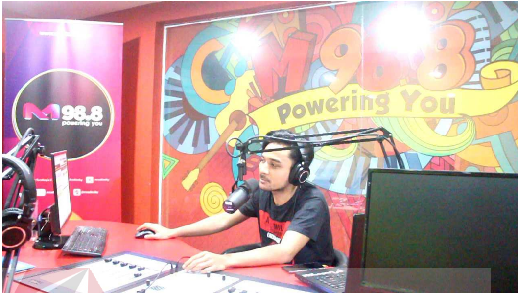
Gambar 2.4 Ruang Siaran M Radio