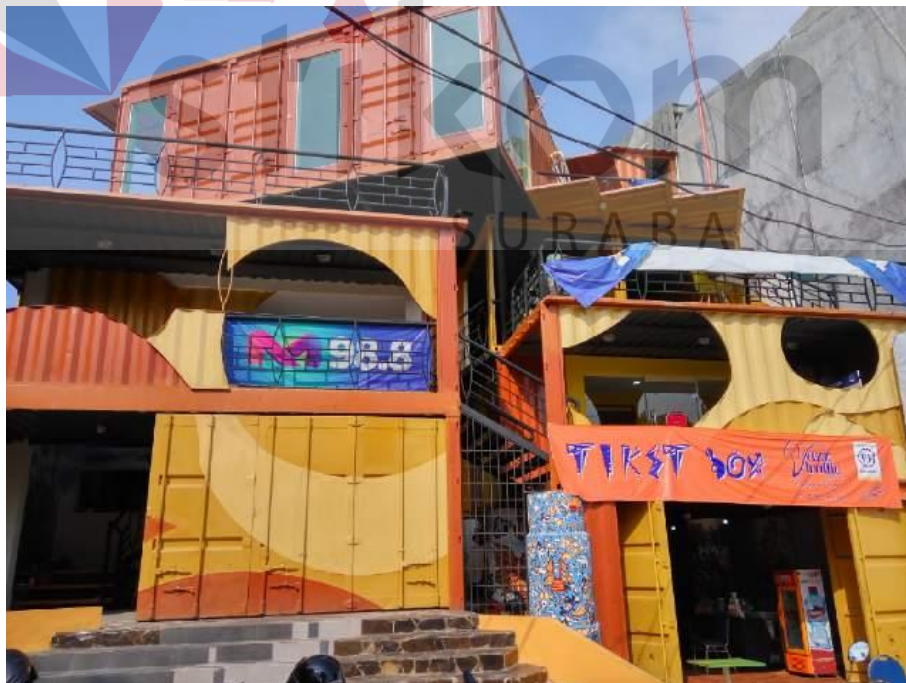
Gambar 2.3 Kantor M Radio