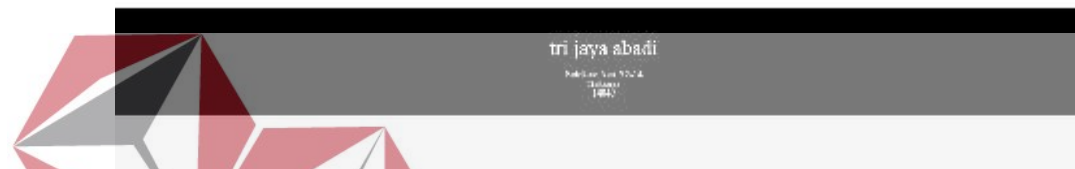
Gambar 4.8 Kontak dan Alamat (Olahan pribadi)

Pada menu ini menampilkan kontak dan alamat perusahaan.