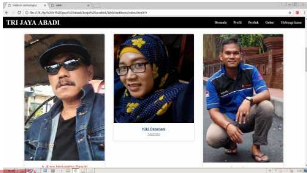
Gambar 4.3 Profil Pengurus Perusahaan