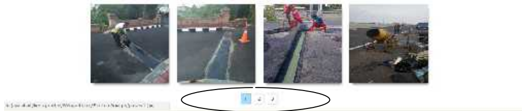
Gambar 4.7 Tombol Galeri