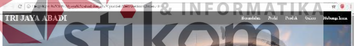
Gambar: 4.2 Tombol Menu Slideshow