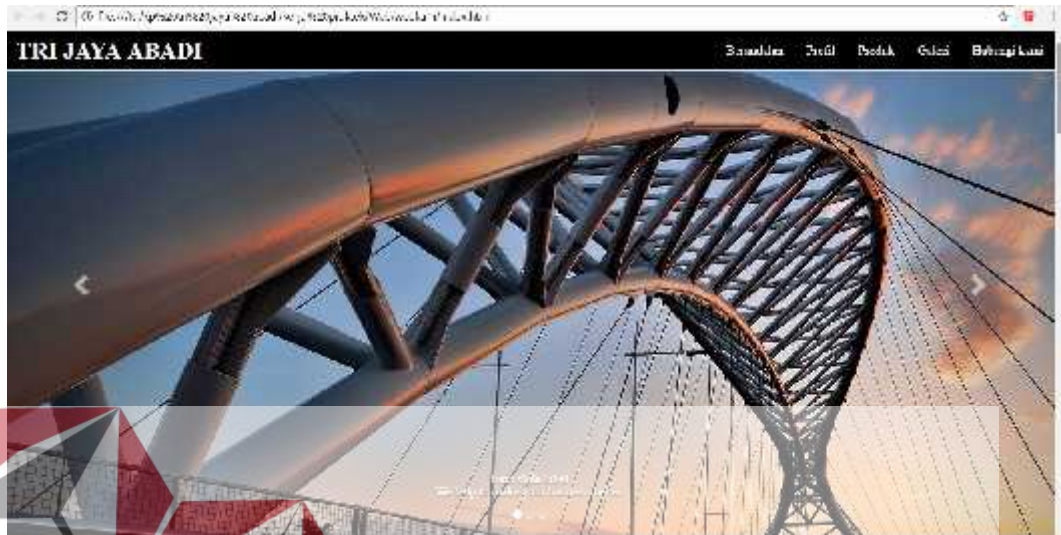
Gambar: 4.1 Tampilan Slideshow

Pada menu ini menampilkan bagian atas website yang berisi foto Slideshow .