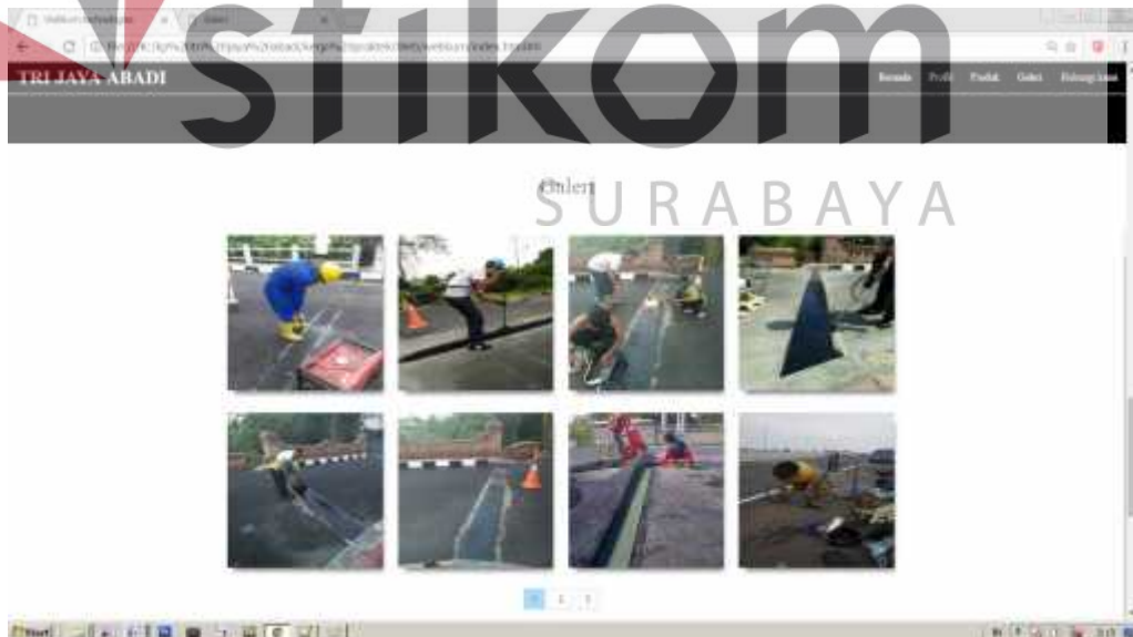
Gambar 4.6 Galeri Aktivitas

Pada menu ini menampilkan galeri aktivitas CV. Tri Jaya Abadi.