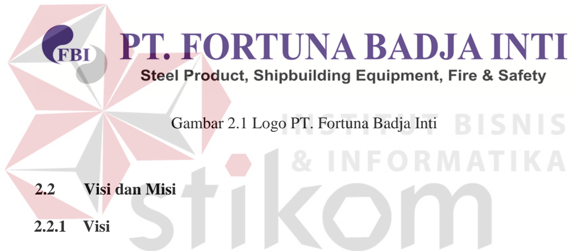
Gambar 2.1 Logo PT. Fortuna Badja Inti