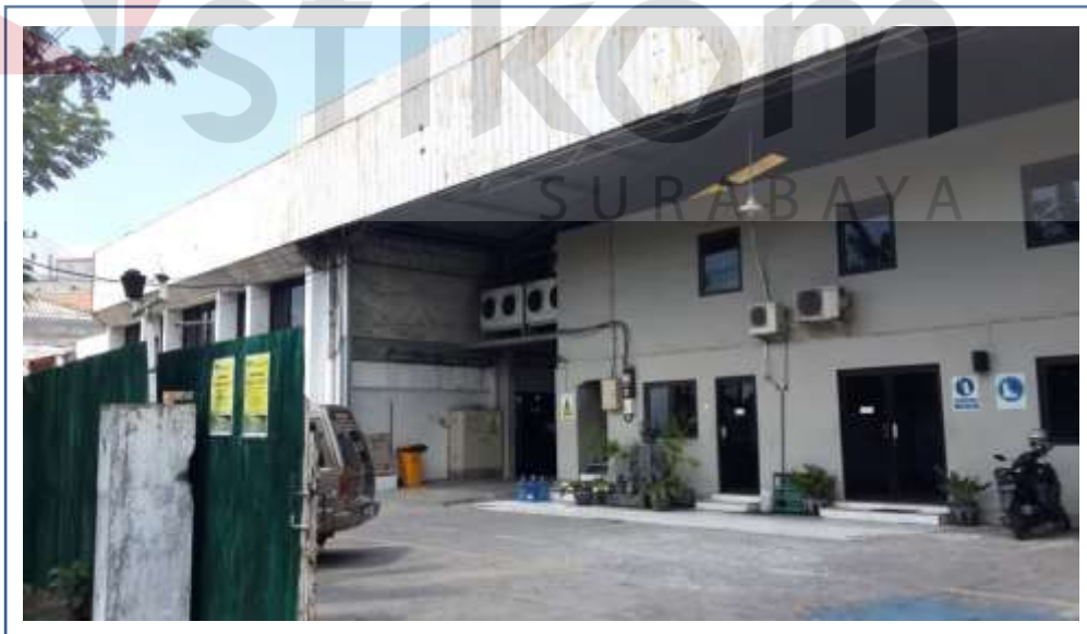
Gambar 2.1 Nampak Depan Kantor PT. Usaha Utama Bersaudara