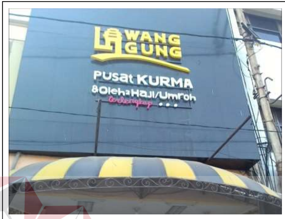
Gambar 2.2 Nampak Depan Tulisan Toko Lawang Agung Berada Di Nyamplungan Surabaya