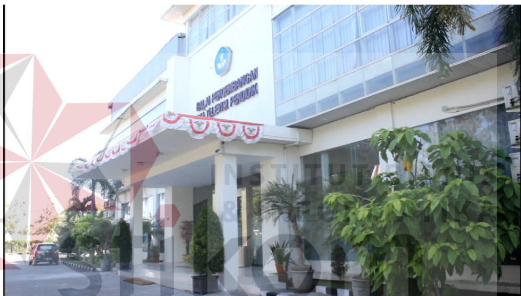
Gambar 2.3 Gedung BPMTTP

Penampakan gedung Balai Pengembangan Media Televisi Pendidikan