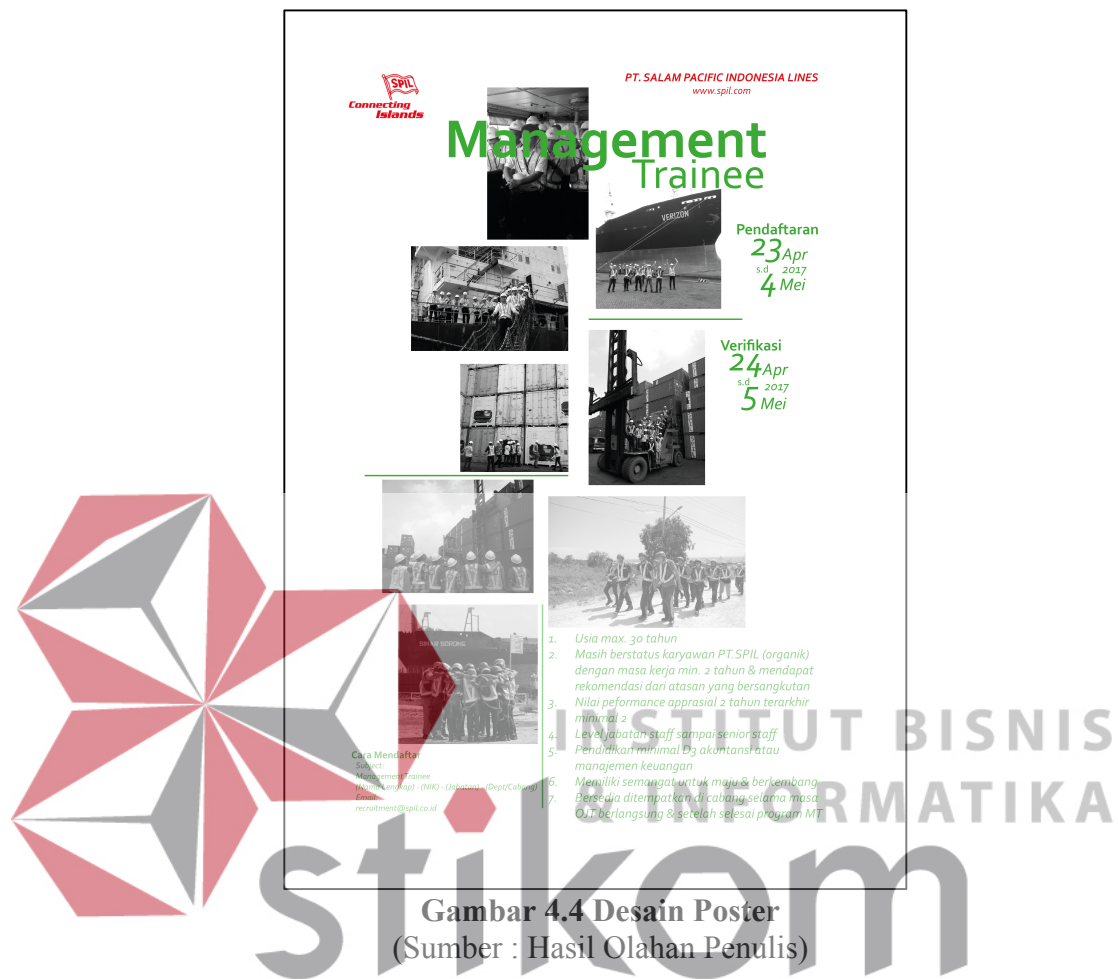
Gambar 4.4 Desain Poster

Pada gambar 4.4 menunjukan desain poster yang berbahan kertas artpaper dengan laminasi doff berukuran A3 (420mm x 297mm). Desain poster tersebut terdiri dari satu logo PT. SPIL dan delapan foto yang menunjukan kegiatan-kegiatan selama management trainee yang menggambarkan solidarity sesuai dengan konsep yang didapatkan beserta teks yang berisikan keterangan dan syarat untuk mengikuti kegiatan management trainee . Foto pada poster dibuat hitam putih agar sesuai dengan konsep solidarity yang bertujuan sebagai momen untuk dikenang dari warna hitam putih itu sendiri. Pada teks dibuat bewarna hijau yang berartikan seagai warna ciri khas perusahaan PT. SPIL.