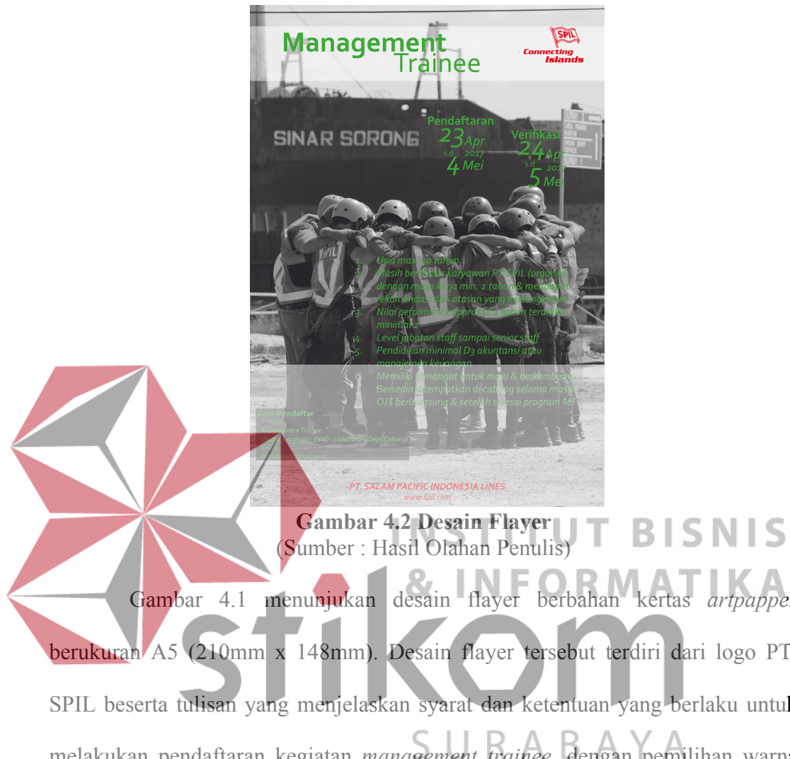
Gambar 4.2 Desain Flyer

Gambar 4.1 menunjukkan desain flyer berbahan kertas artpaper berukuran A5 (210mm x 148mm). Desain flyer tersebut terdiri dari logo PT. SPIL beserta tulisan yang menjelaskan syarat dan ketentuan yang berlaku untuk melakukan pendaftaran kegiatan management trainee , dengan pemilihan warna pada teks dibuat hijau karena sesuai dengan warna dari ciri khas yang dimiliki perusahaan. Pada background terdapat foto yang menunjukkan salah satu kegiatan pada management trainee dibuat berwarna hitam putih yang bertujuan sebagai sebuah foto memorize atau bernuansa sebagai hal yang akan dikenang sehingga menggambarkan solidarity antara para peserta management trainee sesuai dengan konsep yang diperoleh dari data itu sendiri.