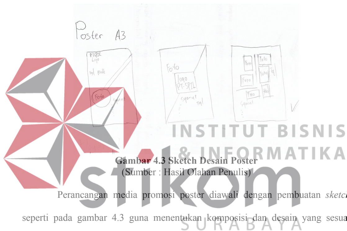
Gambar 4.3 Sketch Desain Poster

Perancangan media promosi poster diawali dengan pembuatan sketch seperti pada gambar 4.3 guna menentukan komposisi dan desain yang sesuai dengan konsep yang telah ditemukan dari hasil observasi atau wawancara singkat. Desain yang terpilih akan dilanjutkan ke proses selanjutnya yaitu digitalisasi melalui sketch yang telah terpilih tersebut.