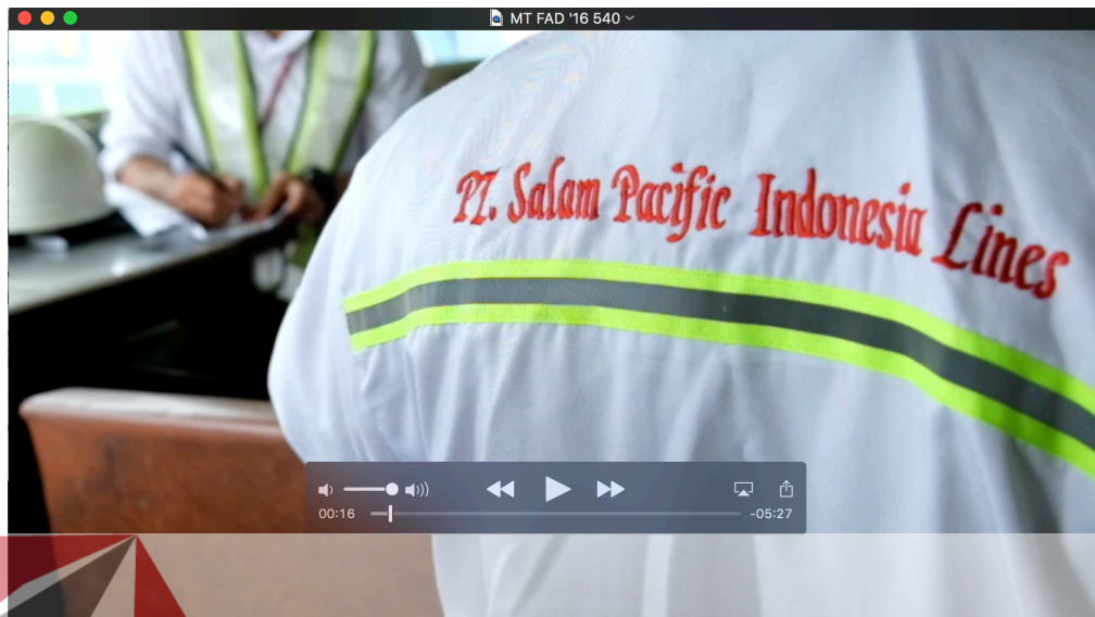
Gambar 4.6 Videography (Sumber : Hasil Olahan Penulis)

Gambar 4.4 menunjukkan cuplikan dari video PT. SPIL sebagai salah satu media rekrutmen management trainee diperuntukan bagi yang telah terpilih dan bergabung menjadi peserta. Videography ini di tampilkan pada saat undangan para peserta yang telah diterima atau disetujui PT. SPIL untuk mengikuti management trainee . Videography ini menampilkan cuplikan - cuplikan kegiatan yang dilakukan selama kegiatan management trainee yang berdurasi kurang lebih 5 menit 30 detik. Para peserta dapat menyaksikan video ini agar lebih memahami apa saja yang dilakukan selama kegiatan supaya lebih memahami kegiatan management trainee yang diadakan PT. SPIL.