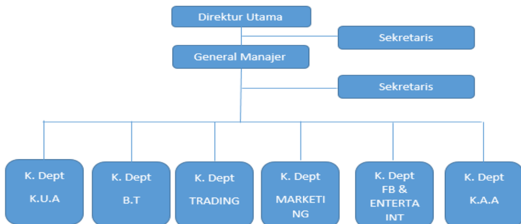
Gambar 2. 2 Struktur Organisasi PT. Kusuma Agrowisata

PT. Kusuma Agrowisata ini menggunakan bentuk struktur organisasi garis (lini) dimana pucuk pimpinan melimpahkan wewenangnya kepada satuan-satuan dibawahnya dalam semua bidang kegiatan, dan bawahan mempertanggungjawabkan tugasnya kepada atasannya. Adapun bagan dari struktur organisasi PT. Kusuma Agrowisata Batu dapat dilihat pada gambar 2.2.