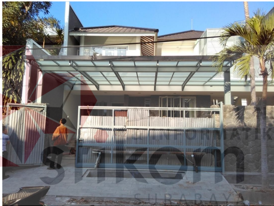
Gambar 2.2 Hasil Desain Eksterior Arsaparama Arc-Interior

Sejak didirikan pada tahun 2010 Arsaparama konsisten memberi kepuasan hasil interior maupun eksterior bagi costumer . Arsaparama terus bergerak dan