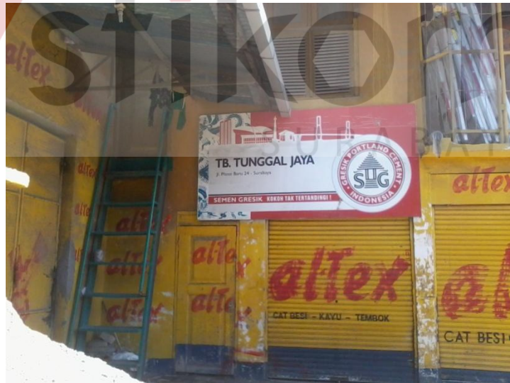
Gambar 2.1 Tampak Depan Toko TB. Tunggal Jaya