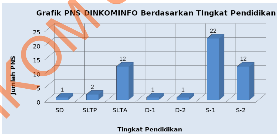
Gambar 2.2 Grafik PNS Dinkominfo Berdasarkan Tingkat Pendidikan ( dinkominfo.surabaya.go.id )