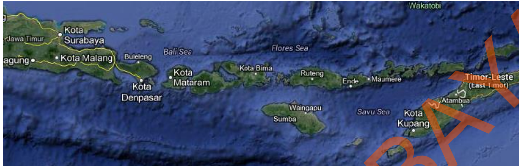
Gambar 2.1 Wilayah Kerja Unit Pemasaran V

dan 2 DPPU) , cabang Denpasar (5 depot dan 4 DPPU), cabang Kupang (8 Depot dan 4 DPPU) dan Timor Lorosae (1 Depot dan 1 DPPU).