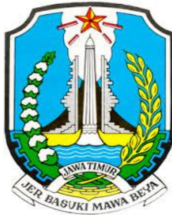
Gambar 2.1 Logo Dinas Kepemudaan dan Keolahragaan Provinsi Jawa Timur

Berikut ini adalah logo dari Dinas Kepemudaan dan Keolahragaan, dapat dilihat pada Gambar 2.1