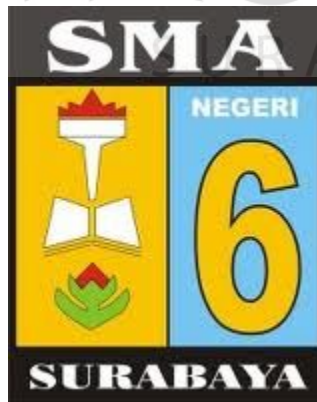
Gambar 2.1 Logo SMA Negeri 6 Surabaya

Logo SMA Negeri 6 Surabaya digambarkan pada Gambar 2.1.