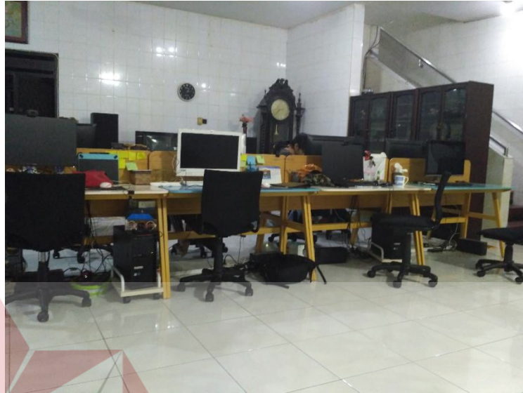
Gambar 2.4 Lokasi Ruang Kerja PT. Medixsoft