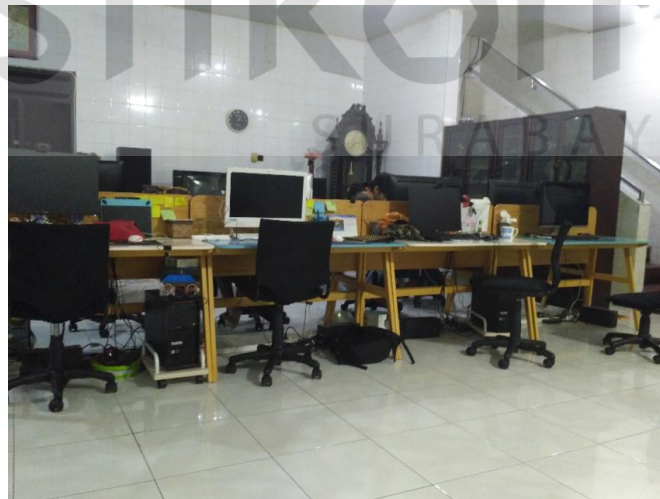
Gambar 2.5 Lokasi Ruang Kerja PT. Medixsoft