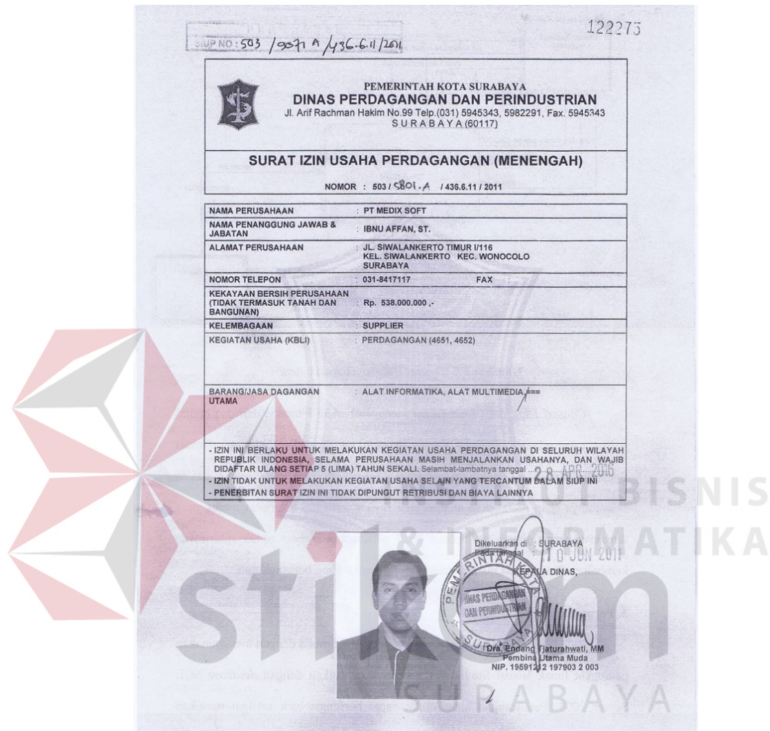
Gambar 2.6 Surat Izin Usaha