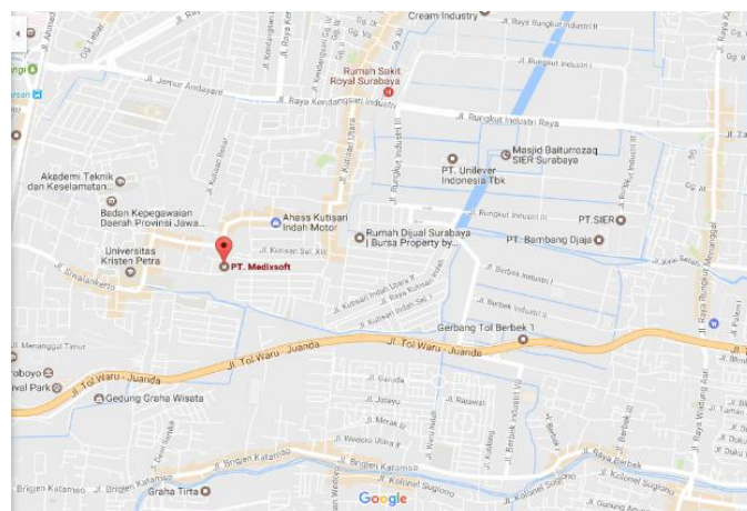
Gambar 2.3 Lokasi PT. Medixsoft