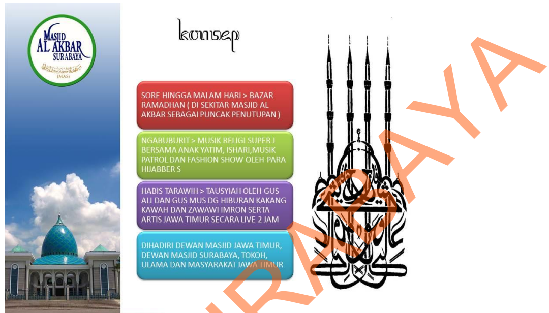
Gbr 5.2.3 Konsep acara secara keseluruhan