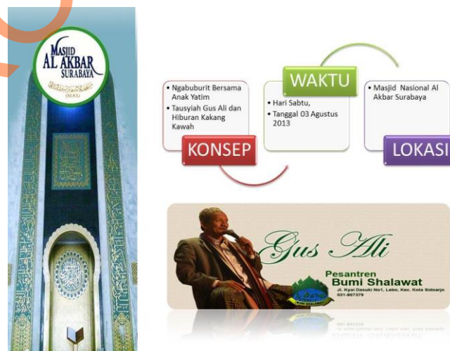
Gbr 5.2.2 Pembuka (Konsep, Waktu, Lokasi) proposal