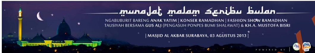
Gbr. Banner Acara Munajat Malam 1000 Bulan (option 1)