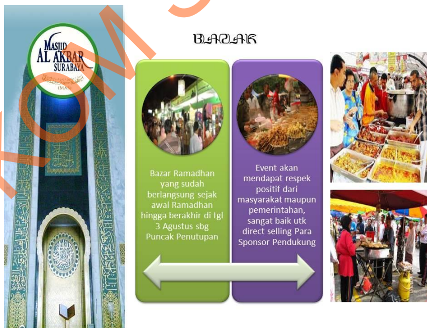
Gbr 5.2.4 Keterangan Bazaar pada acara Munajat Malam 1000 Bulan.