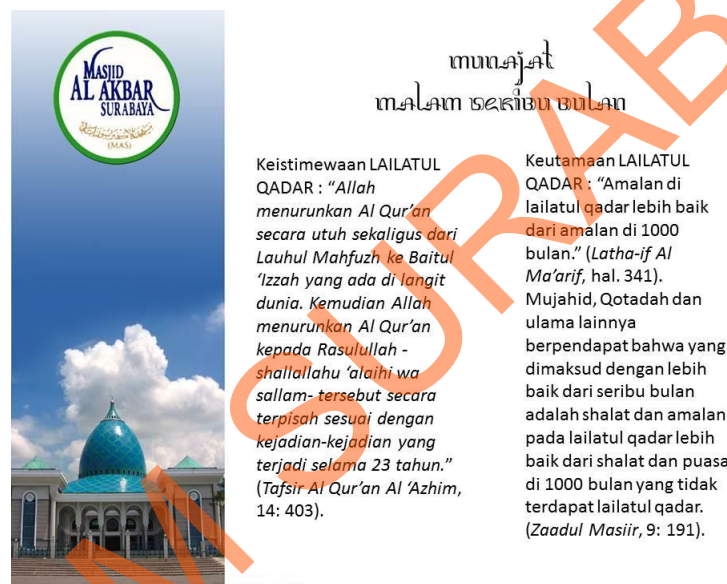
Gbr 5.2.1 cover dari proposalacara Munajat Malam 1000 Bulan

Proposal ini ditujukan kepada pihak venue (tempat yang akan disewa untuk berlangsungnya acara) dan pihak client (pihak sponsor yang ikut bekerjasama dalam acara tersebut). Proposal itu akan disertakan dengan lampiran surat pengantar kepada pihak venue dan pihak client. Berikut adalah contoh format proposal dari ide dan konsep yang terkumpul untuk acara Munajat Malam 1000 Bulan.