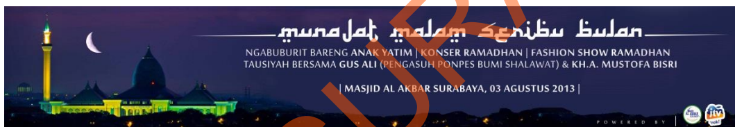
Gbr. Banner Acara Munajat Malam 1000 Bulan (option 2)