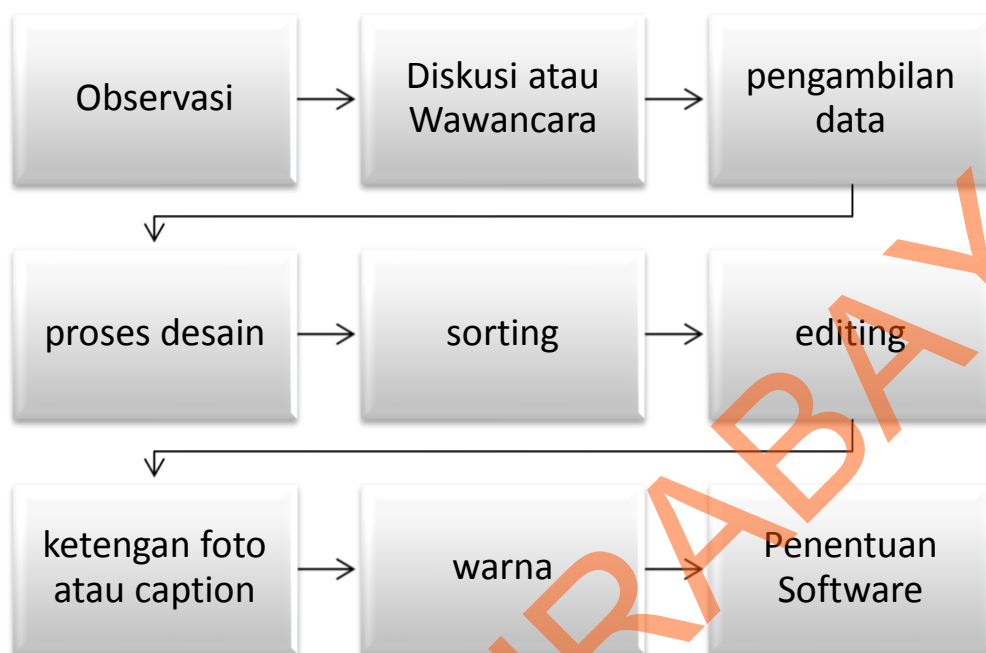
Gambar 3.1 Bagan perancangan