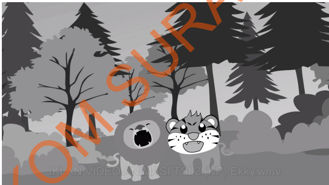
Gambar 5.3 Singa dan Harimau yang Mengaum dengan Keras

Pada scene ke-3 shoot dan zoom in diarahkan pada singa dan harimau yang sedang mengaum. Singa dan Harimau tersebut mencoba mendekati anak kecil yang bersafari.