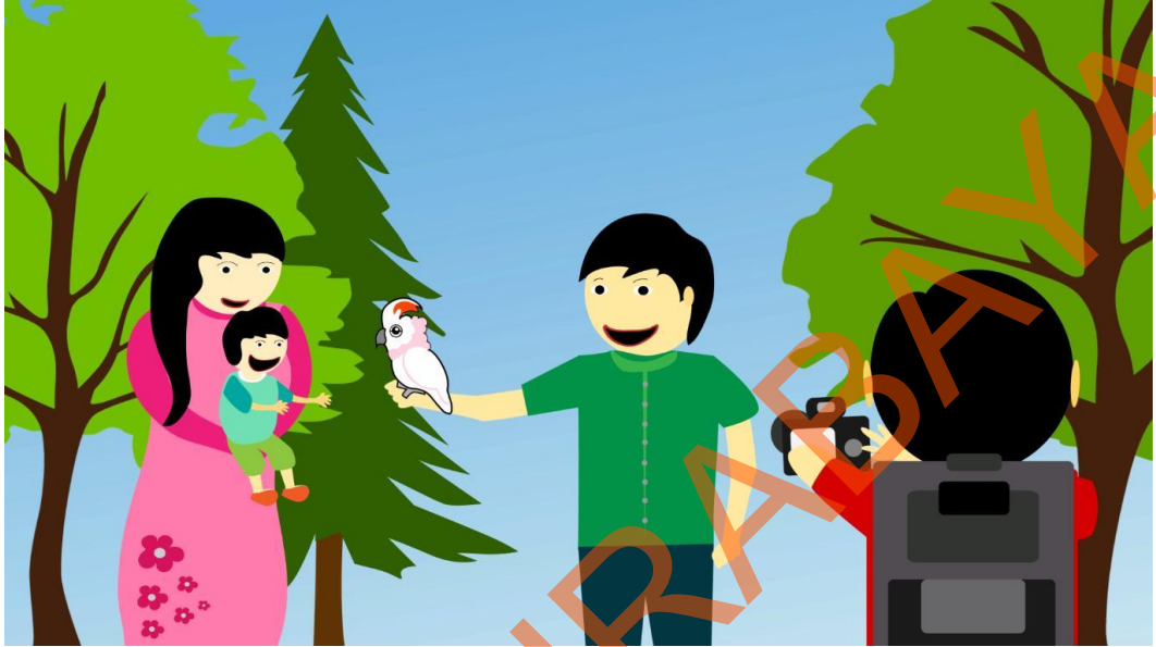
Gambar 5.10 Tokoh Utama sedang Memotret Bapak, Ibu dan anak yang sedang Berinteraksi dengan Seekor Burung

Pada scene ke-10 tampak keluarga bahagia yang sedang berinteraksi dengan seekor burung sembari dipotret oleh tokoh utama. Didalam scene ini juga terjadi interaksi anak kecil dengan seekor burung yang sedang mengedipkan mata manisnya untuk dipotret.