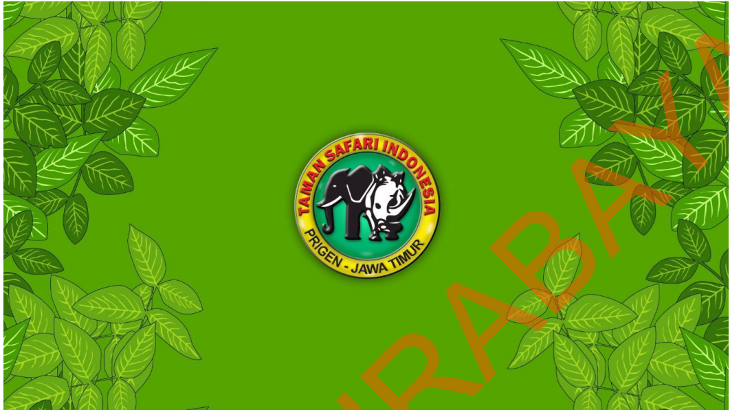
Gambar 5.12 Motion Logo TSI sebagai Penutup Iklan Video Animasi Taman Safari

Pada scene terakhir ini tampak motion atau gerakan animasi dari logo Taman Safari Indonesia II Prigen Jawa Timur. Efek gerak yang terlihat adalah pengurangan opacity dan penambahan opacity serta pengaturan skala logo dari besar ke kecil sehingga menimbulkan efek dramatis.