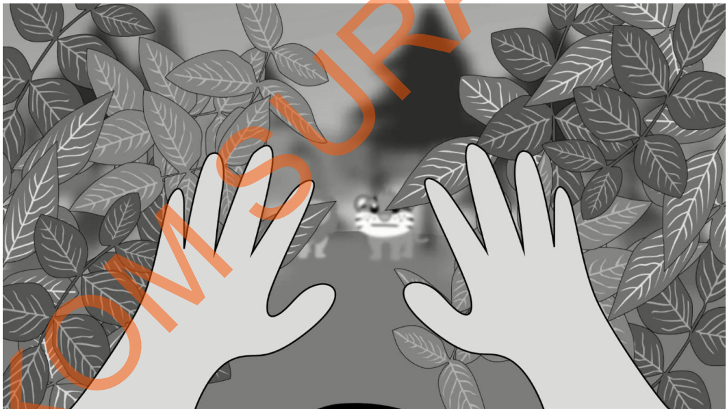
Gambar 5.1 Seorang Anak Yang Sedang Berpetualang sedang Melihat