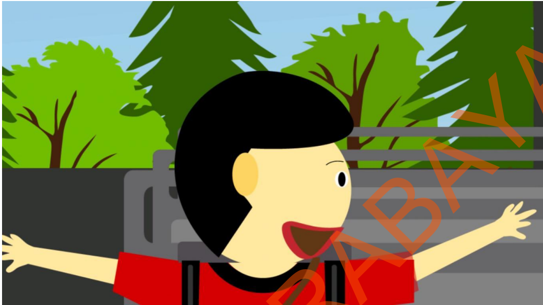
Gambar 5.5 Anak Kecil Melihat Binatang dan Hutan yang Membuatnya Senang dan Ceria Sembari Menunjuk Kearah Jendela Bus Safari

Pada scene ke 5 anak kecil sedang melihat sesuatu yang membuatnya terlihat ceria dan melupakan mimpi buruknya.