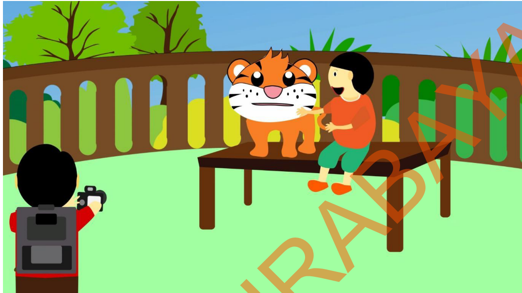
Gambar 5.8 Tokoh Utama sedang Memotret Anak Kecil yang sedang Berpose Bersama Harimau

Pada scene ke 8 tampak tokoh utama (anak kecil memakai ransel dan membawa kamera) sedang memotret pengunjung yaitu anak kecil yang sedang berpose bersama harimau.