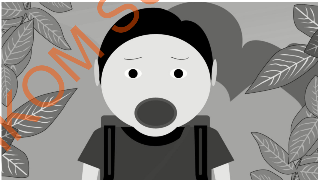
Gambar 5.2 Terkejut Karena Terlihat oleh Dua Ekor Binatang Buas