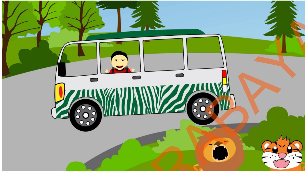
Gambar 5.7 Anak Kecil Melihat Binatang dan Hutan dengan Menggunakan Bus Safari

Pada scene ke 7 bus safari sedang berkeliling di taman safari untuk melihat suasana yang ada pada taman safari. Didalam scene ini terlihat anak kecil yang bersafari mengelilingi taman safari sembari menikmati suasana hutan lebat yang penuh dengan binatang didalamnya.