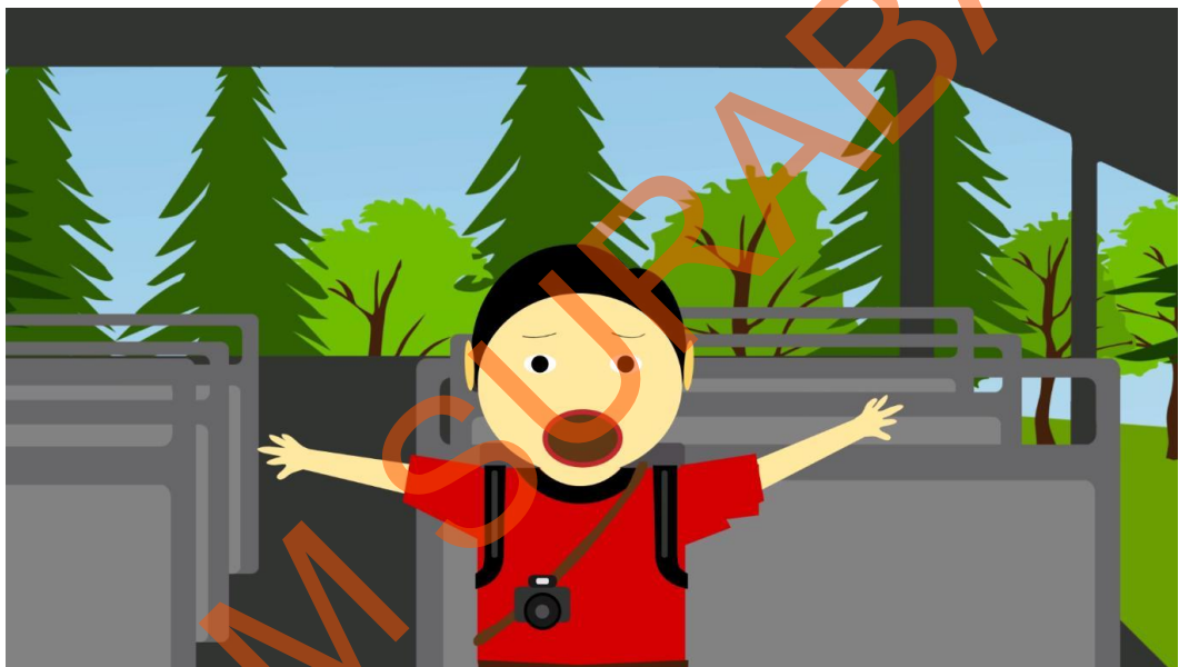
Gambar 5.4 Anak Kecil Terkaget dan Bangun dari Tidurnya yang sedang Berada dalam Bus Safari

Pada scene ke-4 seorang anak kecil terbangun dari tidurnya dan sedang kebingungan didalam bus Safari dan ternyata pertemuan anak kecil dengan dua ekor binatang buas hanyalah mimpi di siang bolong.