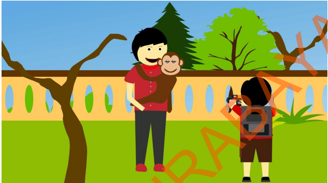
Gambar 5.11 Tokoh Utama sedang Memotret Orang Dewasa yang sedang Berinteraksi bersama seekor monyet

Pada scene ke 11 terlihat seorang pemuda yang sedang menggendong seekor monyet yang manja sembari mengedipkan matanya. Di saat yang sama sang tokoh utama memotret seorang pemuda dengan monyet tersebut.