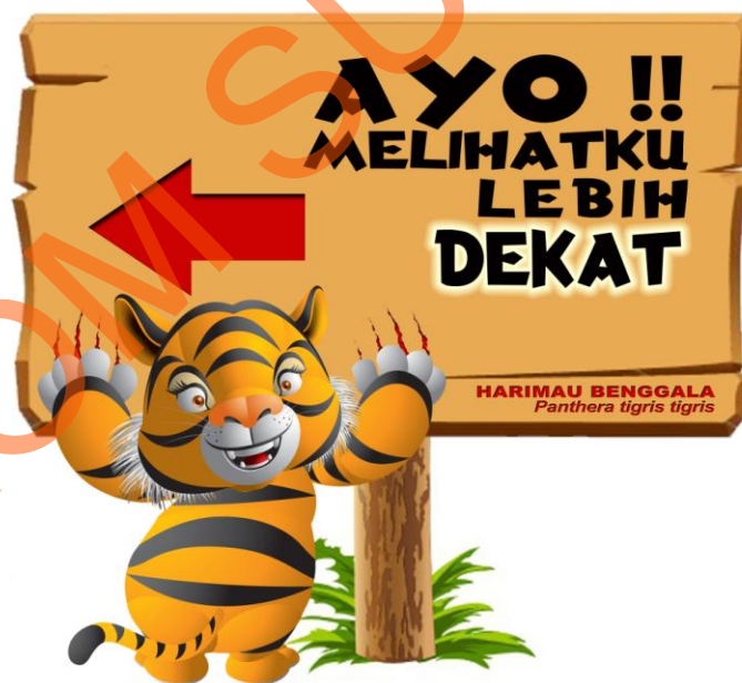
Gambar 5.7 Harimau Benggala

Sign ini diletakkan didekat jembatan setelah pintu masuk kearah Baby Zoo. Sign ini diletakkan ditempat tersebut agar pengunjung tertarik untuk melihat kandang harimau Benggala dari dekat ditempat khusus yang disediakan oleh TSI