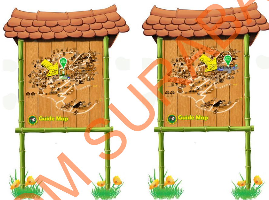
Gambar 6.9 Peta

Sign sebelah kiri diletakkan pada area rekreasi tepatnya berada di depan Antique Car dan berada di persimpangan 3 arah sedangkan untuk yang sebelah kanan diletakkan di area parkir H. Kegunaan dari kedua sign system ini adalah untuk menyampaikan kepada pengunjung di mana mereka berada pada saat mereka melihat sign ini dan mempermudah pengunjung untuk menemukan arah yang ingin mereka tuju ingin kemana dan dari mana mereka mulai melangkah. Sign dengan jenis peta seperti ini diharapkan dapat menjadi media informasi yang lebih optimal serta tidak lepas dari unsur alam dan anak-anak .