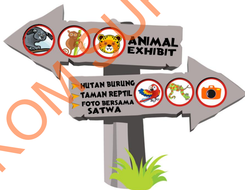
Gambar 5.8 Animals exhibit sign

Sign ini diletakkan pada persimpangan 2 arah yang berada di area foto Baby Zoo. Sign ini diletakkan ditempat tersebut agar pengunjung tertarik mengunjungi exhibit yang lain seperti Pondok Tarsius, Cheetah, dan Binturong