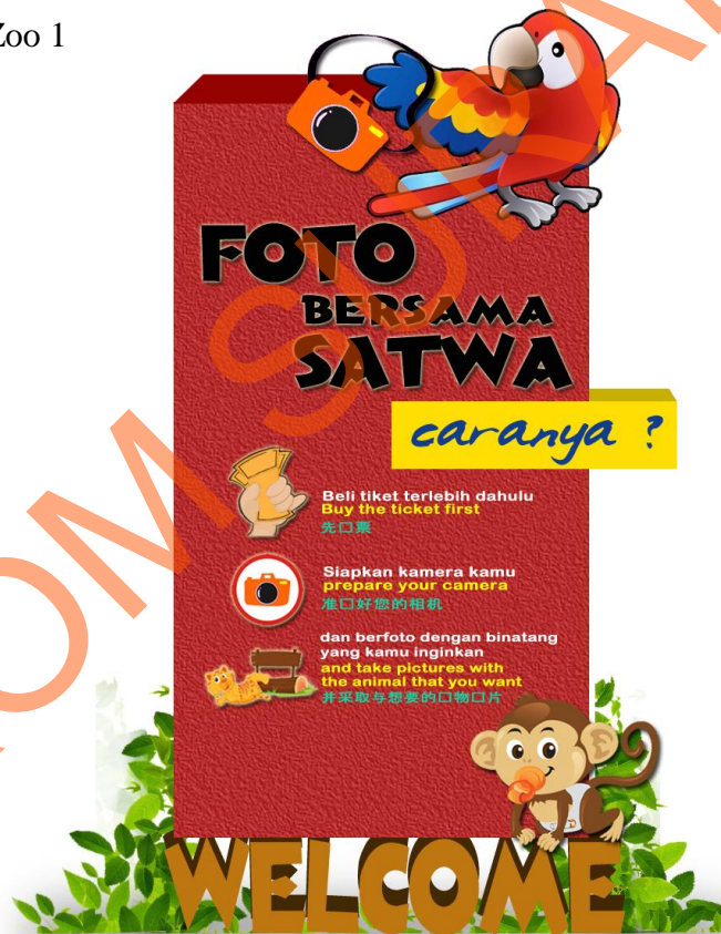
Gambar 5.4 Baby zoo sign 1

Sign ini diletakkan pada area indoor yaitu terminal bus safari. Diletakkan pada area Indoor karena Sign ini berukuran besar dan bertuliskan welcome yang berarti selamat datang yang ditujukan bagi pengunjung yang baru saja datang ke