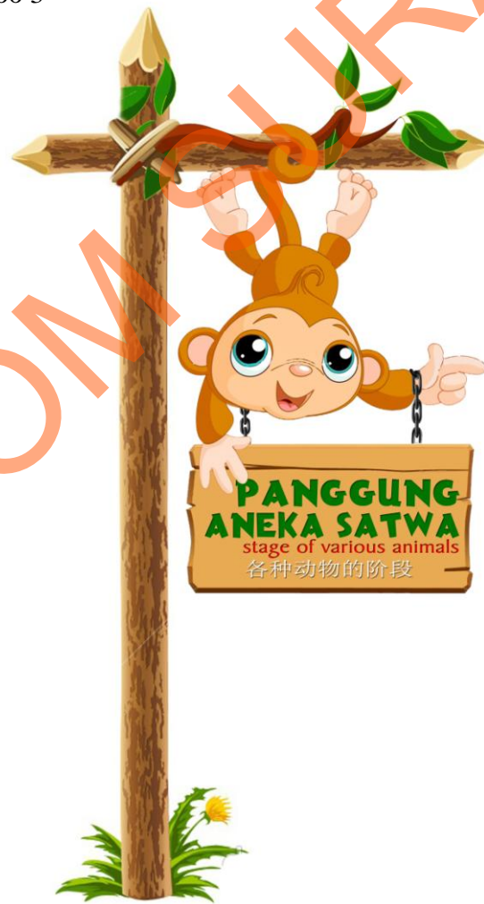
Gambar 5.6 Baby Zoo sign 3