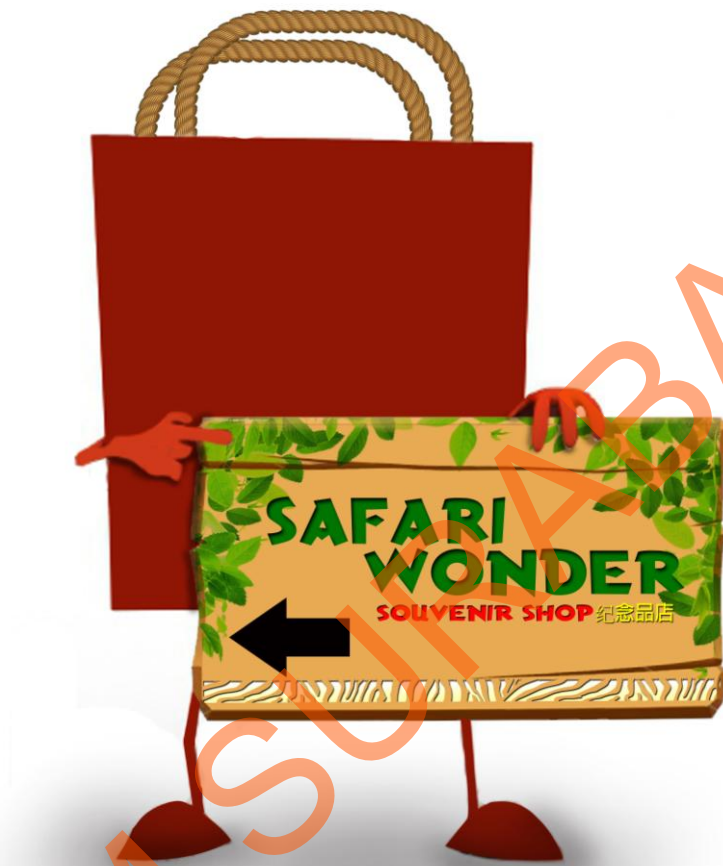
Gambar 5.10 Souvenir Shop Sign System

Sign ini diletakkan pada setiap spot souvenir shop berada seperti di area pertunjukan Temple Of Terror dan pada area Plasa Gajah. Sign ini menggunakan 3 bahasa yang berfungsi untuk mempermudah para wisatawan asing yang datang ke Taman Safari. Menurut hasil observasi pengunjung di Taman Safari kebanyakan wisatawan yang menggunakan bahasa Inggris dan mandarin tetapi tetap mengutamakan Bahasa Indonesia sebagai fokus utama karena Taman Safari Indonesia II ini berada di Indonesia. Penggunaan model paper bag berwarna merah mewakili dari goddie bag yang selalu didapat oleh pengunjung apabila