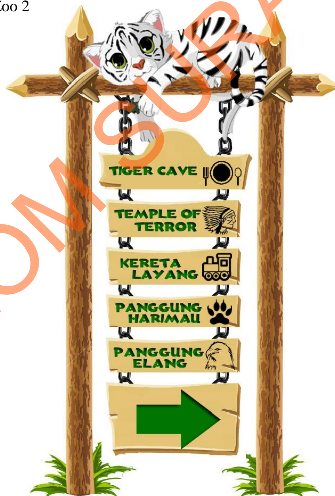
Gambar 5.5 Baby Zoo sign 2