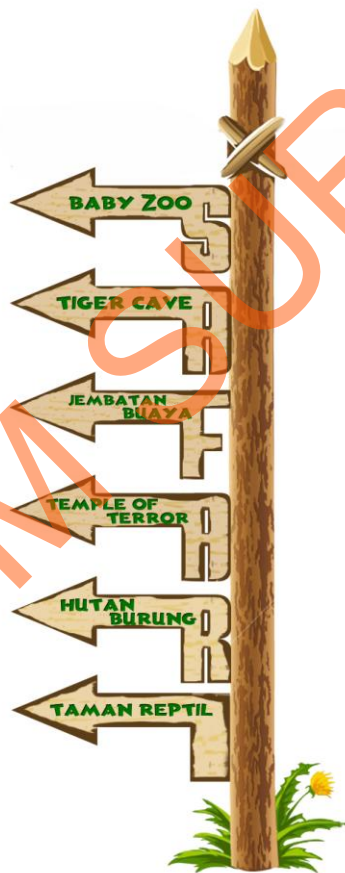
Gambar 5.3 Sign System area Parkir H.c

Desain sign system ini diletakkan pada parkir H tepat menghadap ke ulat bulu di depan area Safari World. Sign ini diletakkan pada area tersebut bertujuan untuk menunjukkan arah bagi pengunjung yang berada dan keluar dari arah Safari