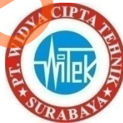
Gambar 2.1 Lambang PT. Widya Cipta Teknik

Lambang PT. Widya Cipta Teknik dapat dilihat pada Gambar 2.1 berikut :