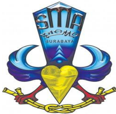
Gambar 2.1 Logo SMA IPIEMS