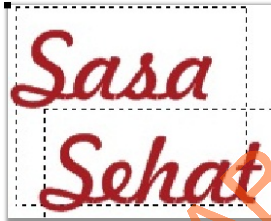
Gambar 5.6 Font Tipografi “Sasa Sehat”

Font Sasa Sehat diletakkan di sisi kanan dari celemek dimaksudkan untuk memudahkan membaca dan cara melihat yang lebih enak. Menyemibangkan sisi celemek dengan alur desain kekanan.