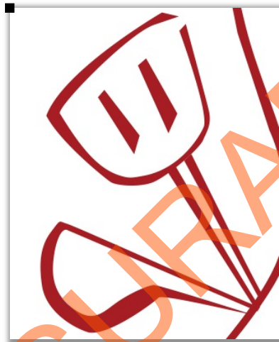
Gambar 5.5 Elemen Alat Masak

yang terbaik untuk keluarganya. Meskipun komunikasi nya kurang tersampaikan, hal ini juga sebagai penyeimbang dari komposisi dari celemek tersebut.