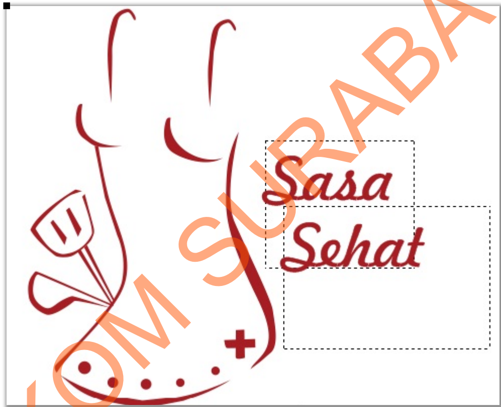
Gambar 5.1 Desain Vector Grafis Ikon Sasa Sehat

Grafis ikon diatas merupakan desain yang telah di approve dan di setuju oleh mentor Alessis Creative. Arti dari ikon ini adalah Sasa adalah produk masakan yang di simbolkan dengan gambar spatula dan sendok serta celemek yang berbentuk silhoutte wanita, yang mengartikan bahwa Sasa ini memang target nya adalah wanita yang suka masak dan wanita yang cerdas serta feminim.