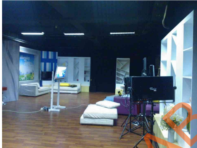
Gambar 4.5 Foto Studio Produksi

Gambar tersebut merupakan gambar studio produksi BBS TV Surabaya yang biasanya dijadikan tempat untuk melakukan produksi program televisi.