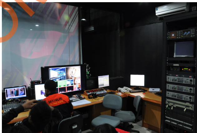
Gambar 4.6 Studio Micro Control Room BBSTV Surabaya

Gambar tersebut merupakan gambar studio produksi BBS TV Surabaya yang biasanya dijadikan tempat untuk melakukan produksi program televisi.