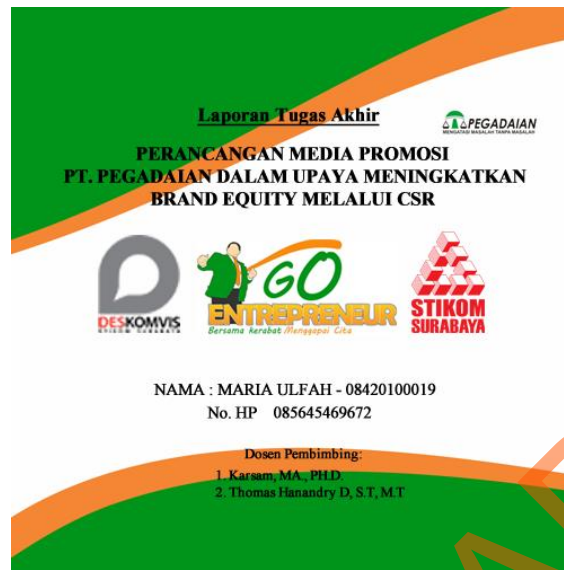
Gambar 4.13 Sketsa Cover CD