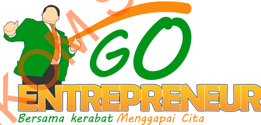
Gambar 4.1 Logo Event

Logo diimplementasikan pada setiap sarana komunikasi visual pendukung program CSR Go Entrepreneur