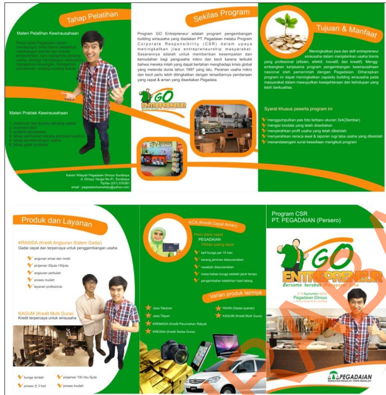
Gambar 4.4 Brosur Program Go Entrepreneur Pegadaian