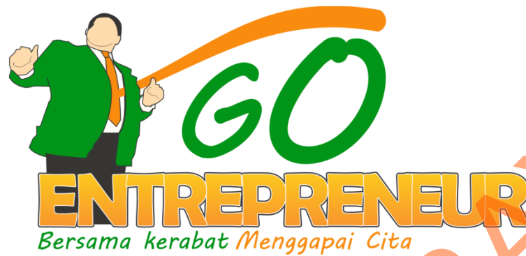
Gambar 4.7 Stiker