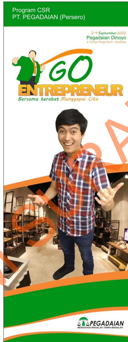
Gambar 4.6 Implementasi Banner