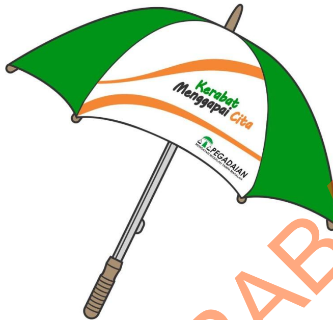
Gambar 4.10 Payung