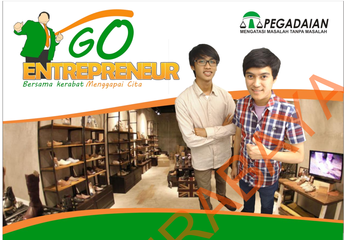
Gambar 4.2 Implementasi Billboard