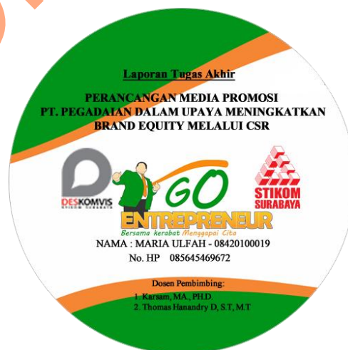
Gambar 4.14 CD

Gambar pada CD disesuaikan dengan cover CD yang berfokus pada gambar tokoh entrepreneur dengan posisi judul tugas akhir juga berada di atas logo DKV disebelah kiri dan logo stikom sebelah kanan.