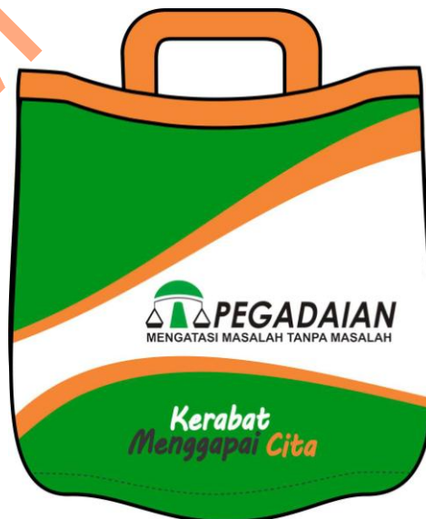
Gambar 4.11 Tas