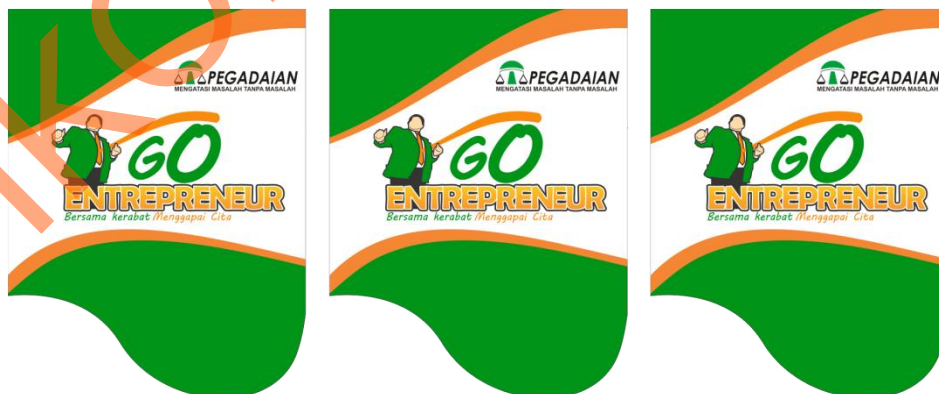
Gambar 4.5 Flag chain Program Go Entrepreneur Pegadaian