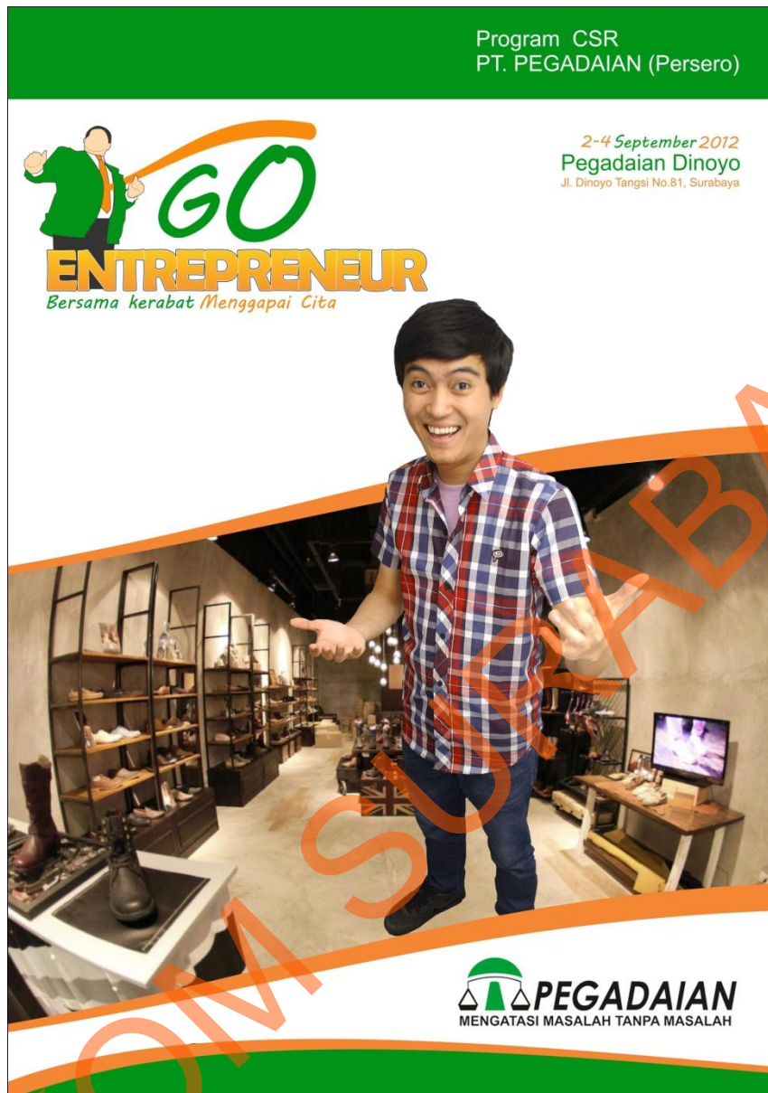
Gambar 4.3 Implementasi Poster

2. Bellow The Line , yang digunakan adalah: