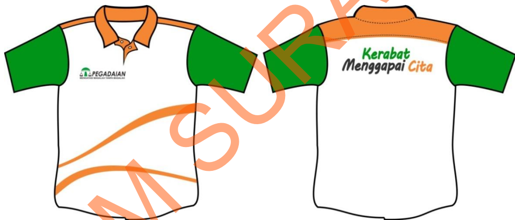
Gambar 4.8 Kaos