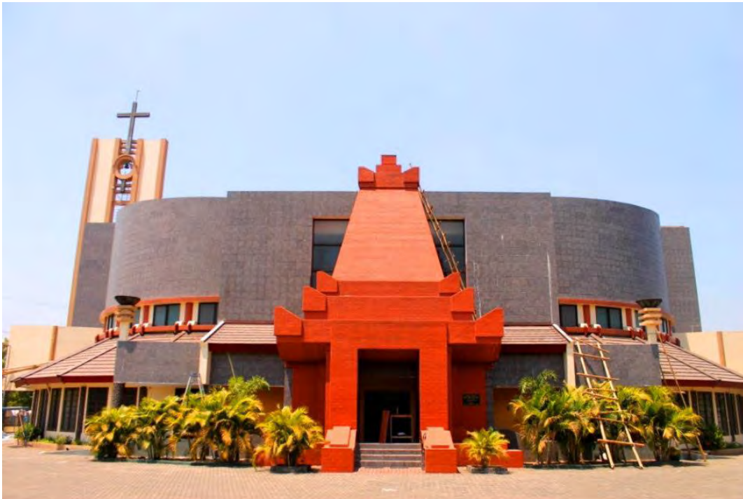
Gambar 1. Tampak depan Gereja Katolik Santo Paulus Juanda