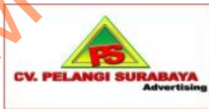
Gambar 4.1 Logo CV. Pelangi Surabaya Advertising

CV. Pelangi Surabaya Advertising berkeyakinan penuh dalam menangani proyek hingga memenuhi standar kualitas pekerjaan dengan mutu yang tinggi. CV. Pelangi Surabaya Advertising juga memiliki suatu keyakinan bahwa kualitas pekerjaan yang baik dimulai dari tahap perencanaan, desain, serta ukuran yang presisi sampai dengan pelaksanaan di lapangan.