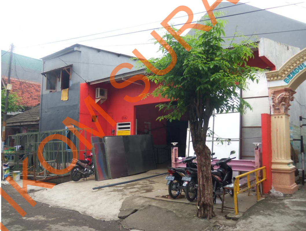
Gambar 4.2 Head Office

CV. Pelangi Surabaya Advertising berada di Jalan Bendul Merisi Gang Besar Selatan no. 13A, Surabaya 60239. Telepon: (031)8470218. Fax: (031)8480633. E-mail: pelangisby@yahoo.com