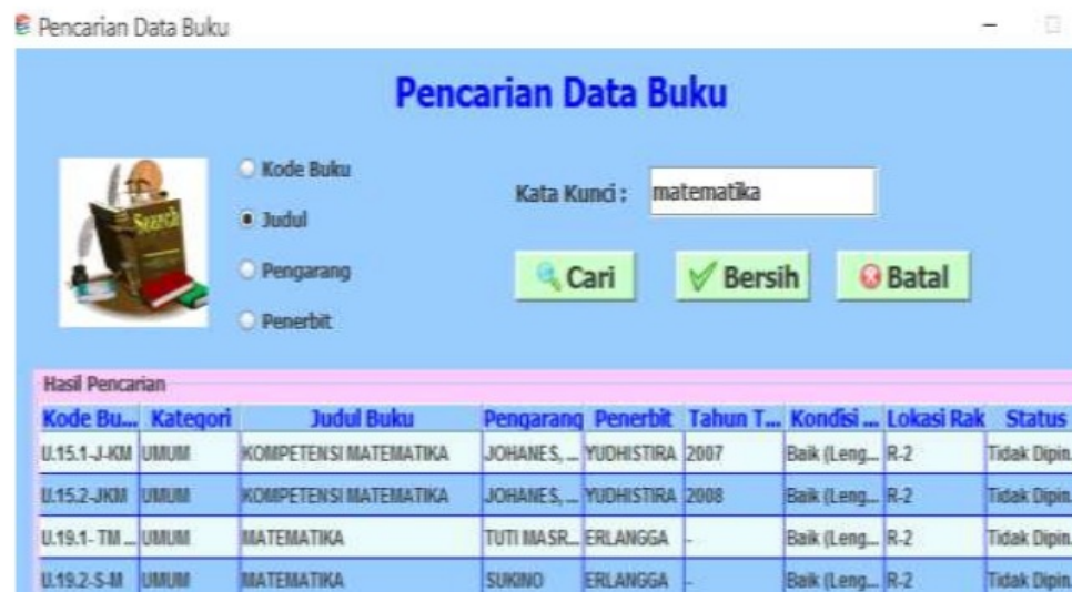
Gambar 3. Tampilan Form Pencarian Data Buku.

Dalam pencarian data buku, pencarian dapat dilakukan berdasarkan pada kode buku, judul, pengarang atau penerbit.