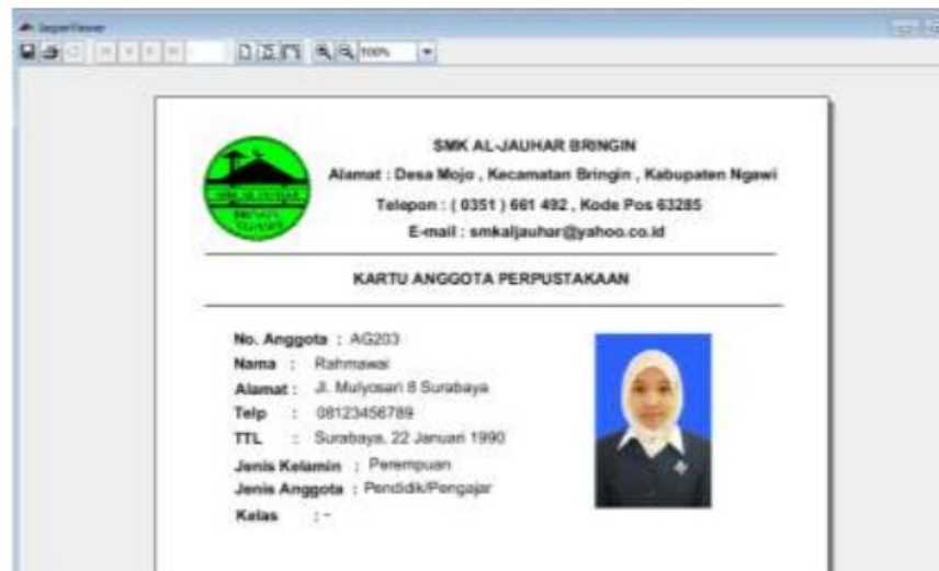
Gambar 7. Tampilan Kartu Anggota Perpustakaan siap cetak (print).