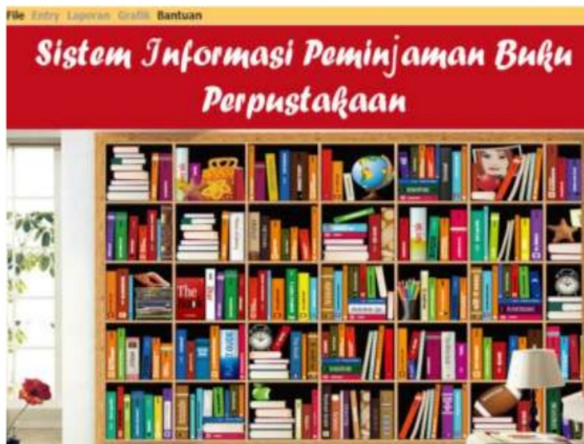
Gambar 2. Tampilan Utama Sistem Informasi Perpustakaan.

Gambar 2 menunjukkan halaman profil dari aplikasi Sistem Informasi Sirkulasi dan Inventarisasi Buku Perpustakaan di kedua sekolah. Di halaman profil terdapat menu file , entry , laporan , grafik dan bantuan .