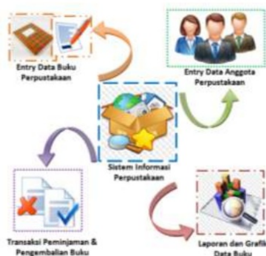
Gambar 1. Desain Sistem Informasi Perpustakaan

Sesuai dengan metode pendekatan penyelesaian masalah di atas, untuk mewujudkan Sistem Informasi Sirkulasi dan Inventarisasi Buku Perpustakaan, disusun rencana kegiatan 12 lengkap dengan kriteria, indikator pencapaian tujuan dan tolok ukur keberhasilan, dapat dilihat pada gambar berikut: