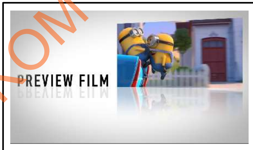
Gambar 5.3 Screen Shot Scene 1

Di awal scene menampilkan background glossy dengan dominan warna putih dan abu-abu. Muncul teks “Preview Film” salah satu yang akan dibahas dalam program acara Movie Zone. Dari atas muncul adegan trailer dari sebuah film animasi “Despicable Me 2”.