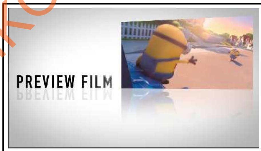
Gambar 5.2 Screenshot Tampilan OBB

Elemen-elemen yang digunakan untuk pembuatan motion graphic OBB ini terdiri dari teks, cuplikan video trailer film, efek bayangan dan efek cahaya untuk memberikan efek pada teks. Ada beberapa teks yang digunakan dalam pembuatan motion graphic ini, mulai dari DIN Schrift, Comica BD, COUTURE dan Wanted M54. Pada background hanya menampilkan efek glossy , yang berkesan eksklusif, mewah dan elegan.