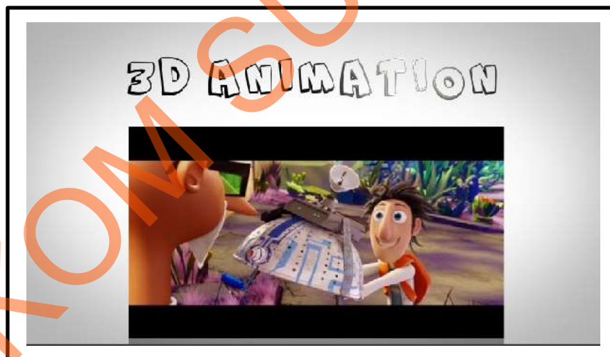
Gambar 5.5 Screen Shot Scene 3

Pergerakan pada scene 3 hampir sama pada adegan scene 2, yaitu menampilkan cuplikan trailer film “Cloudy With a Chance of Meatballs 2” yang merupakan film animasi 3D . Setelah trailer film muncul, kemudian keluar pergerakan teks “3D Animation” yang dapat dibahas pada program acara Movie Zone. Jadi di program acara Movie Zone tidak hanya membahas film-film bergenre Action, Drama dan lainnya melainkan juga membahas film animasi yang sedang happening sekarang ini.