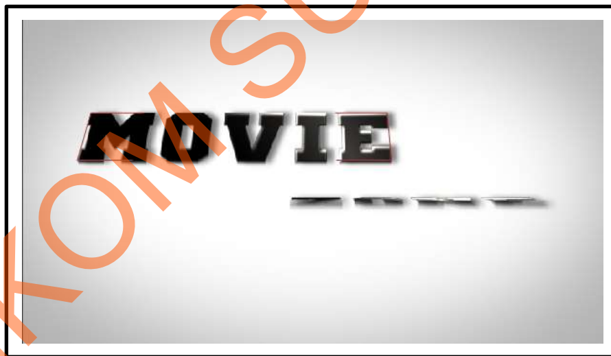
Gambar 5.7 Screen Shot Scene 5

Pada scene terakhir menampilkan pergerakan judul program acara Movie Zone. Pergerakan judul program acara dengan menggunakan teknik “Bouncing” yaitu teks bergerak ke depan dan ke belakang seperti ayunan yang bergerak. Untuk judul program acara menggunakan font “Wanted M54” dengan karakteristik yang tegas, dapat terlihat dengan mudah serta memiliki bentuk fisik yang besar dan tebal.