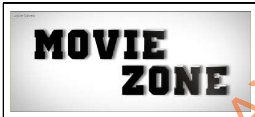
Gambar 5.1 Logo Movie Zone